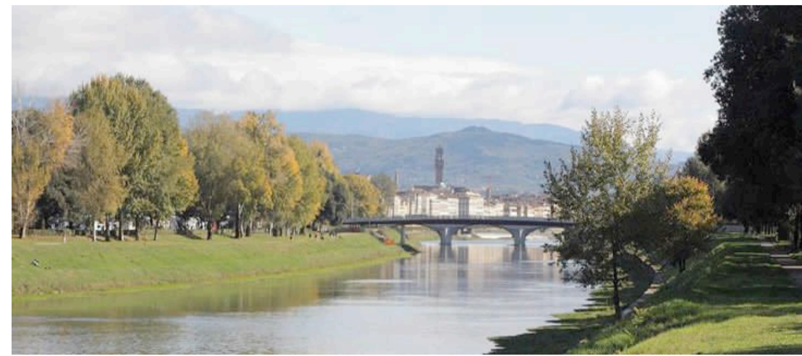
PARCO DELLE CASCINE