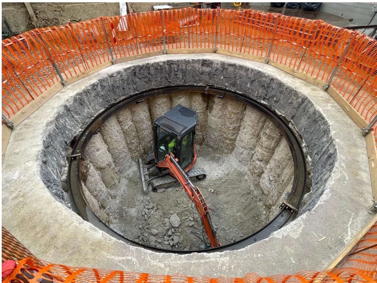
Figura 12 - Pozzo Via Cittadella