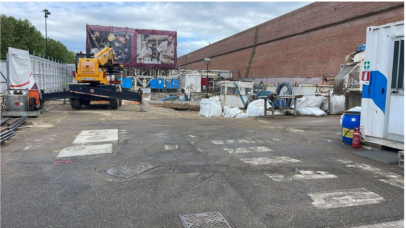
Figura 11 - Fortezza Area 4