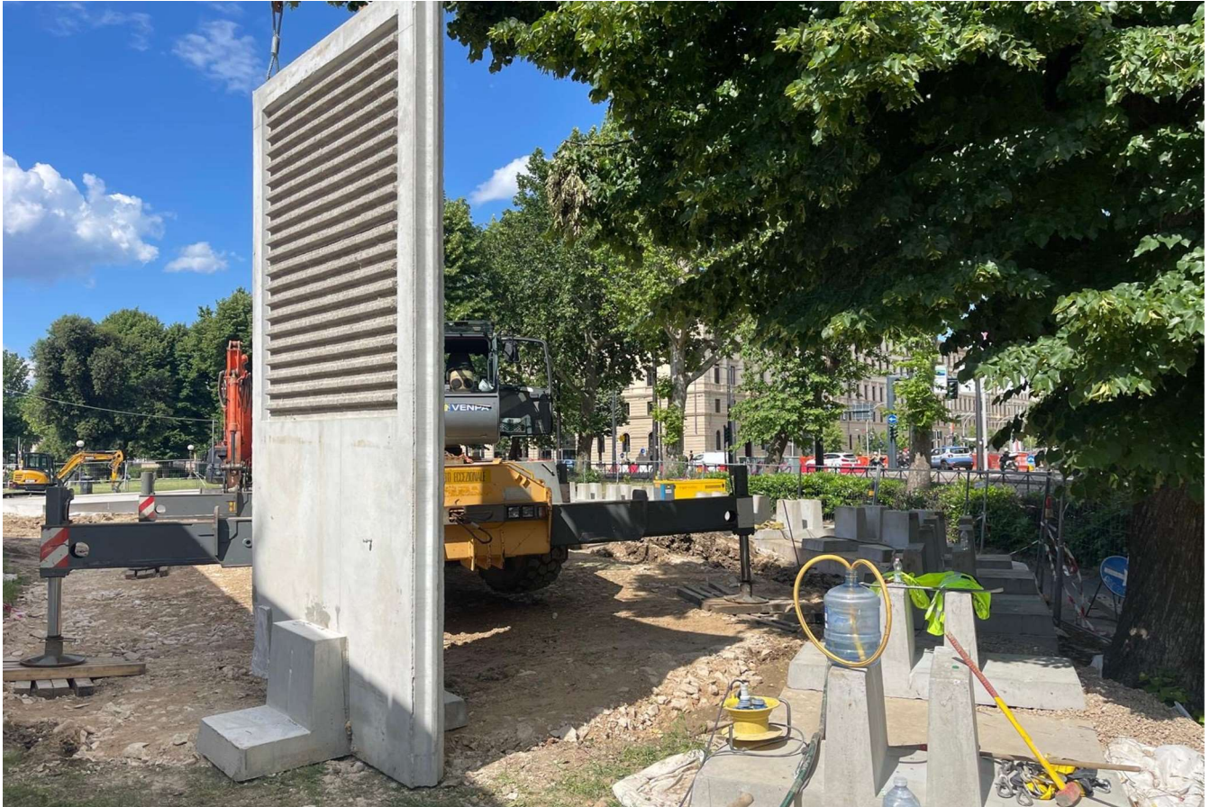
Figura 8 - Fortezza Area 1