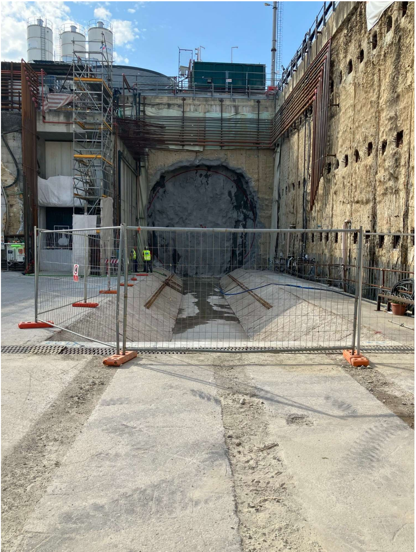
Figura 4 - Imbocco Binario Dispari