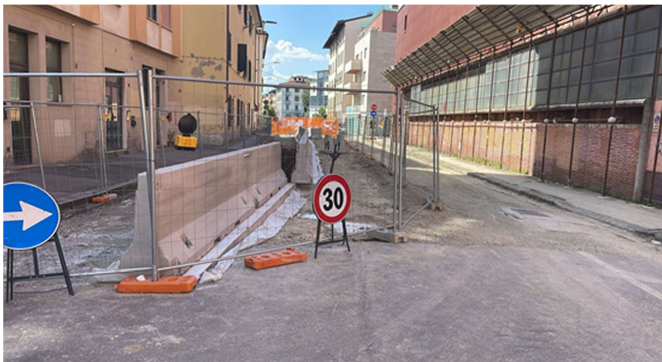
Figura 13 - Via delle Ghiacciaie