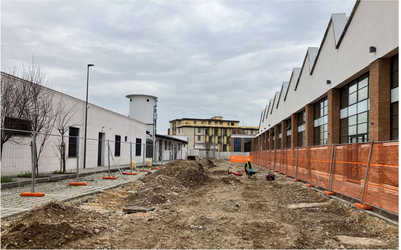
Figura 14 - Viale Redi