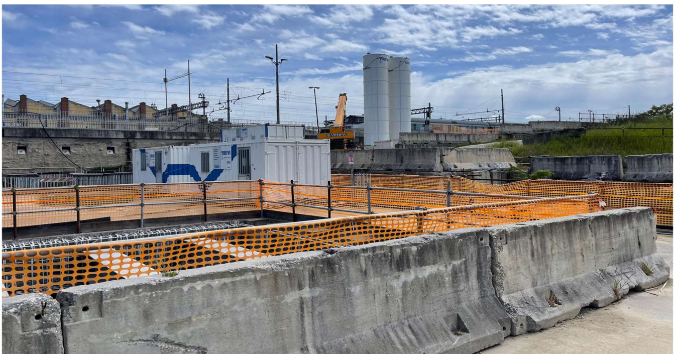
Figura 2 – Pozzo Sud