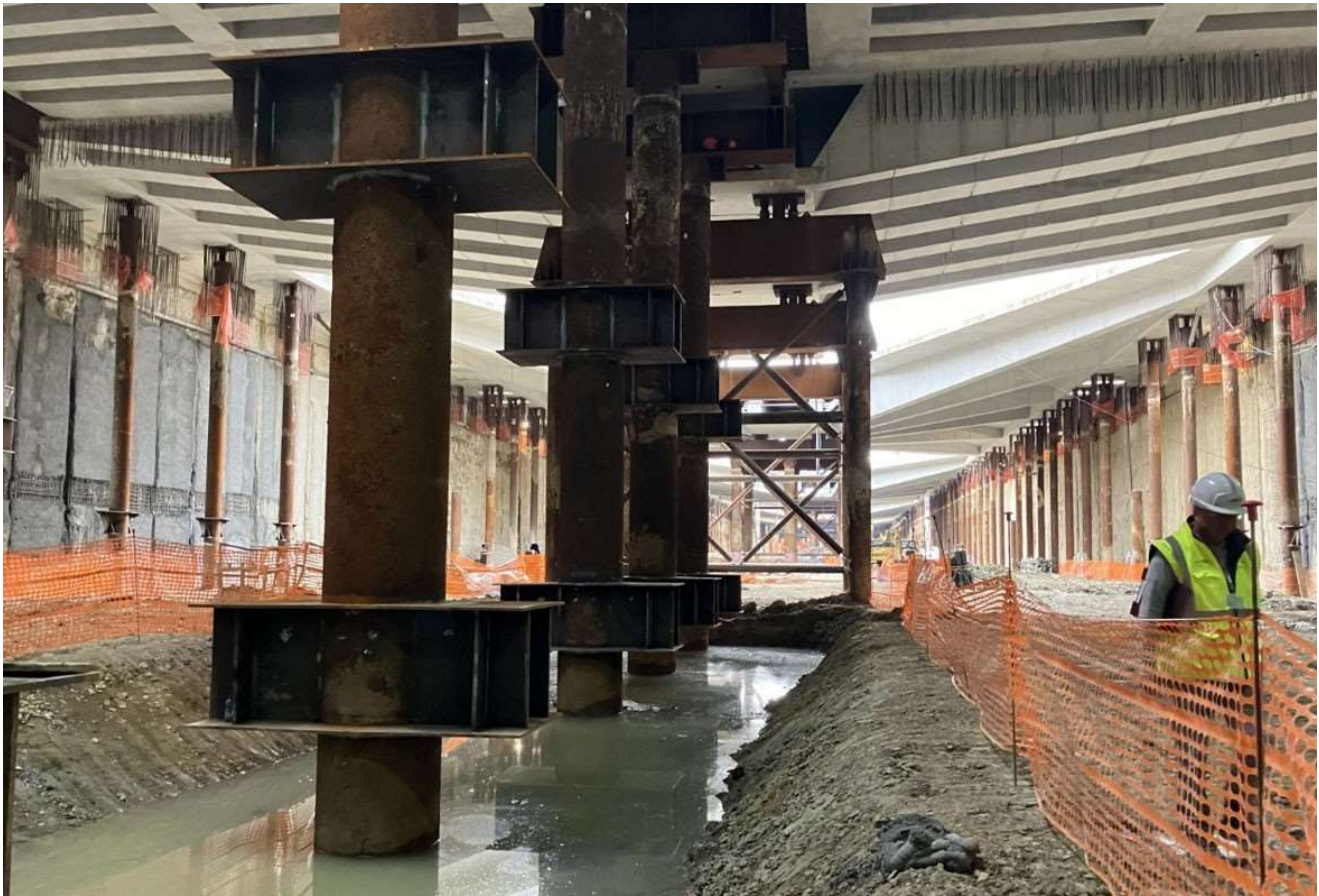
Figura 1 - Stazione AV