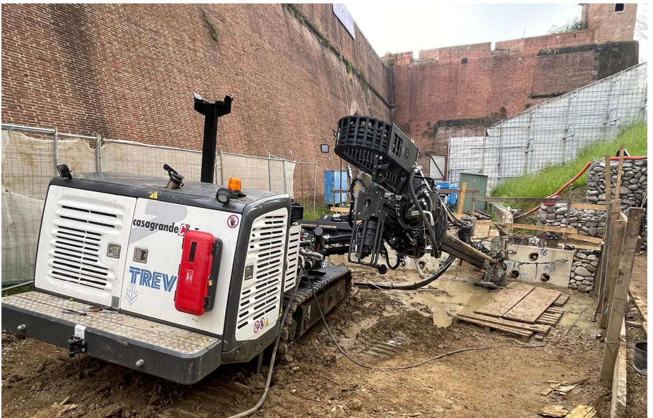
Figura 9 - Fortezza Area 2