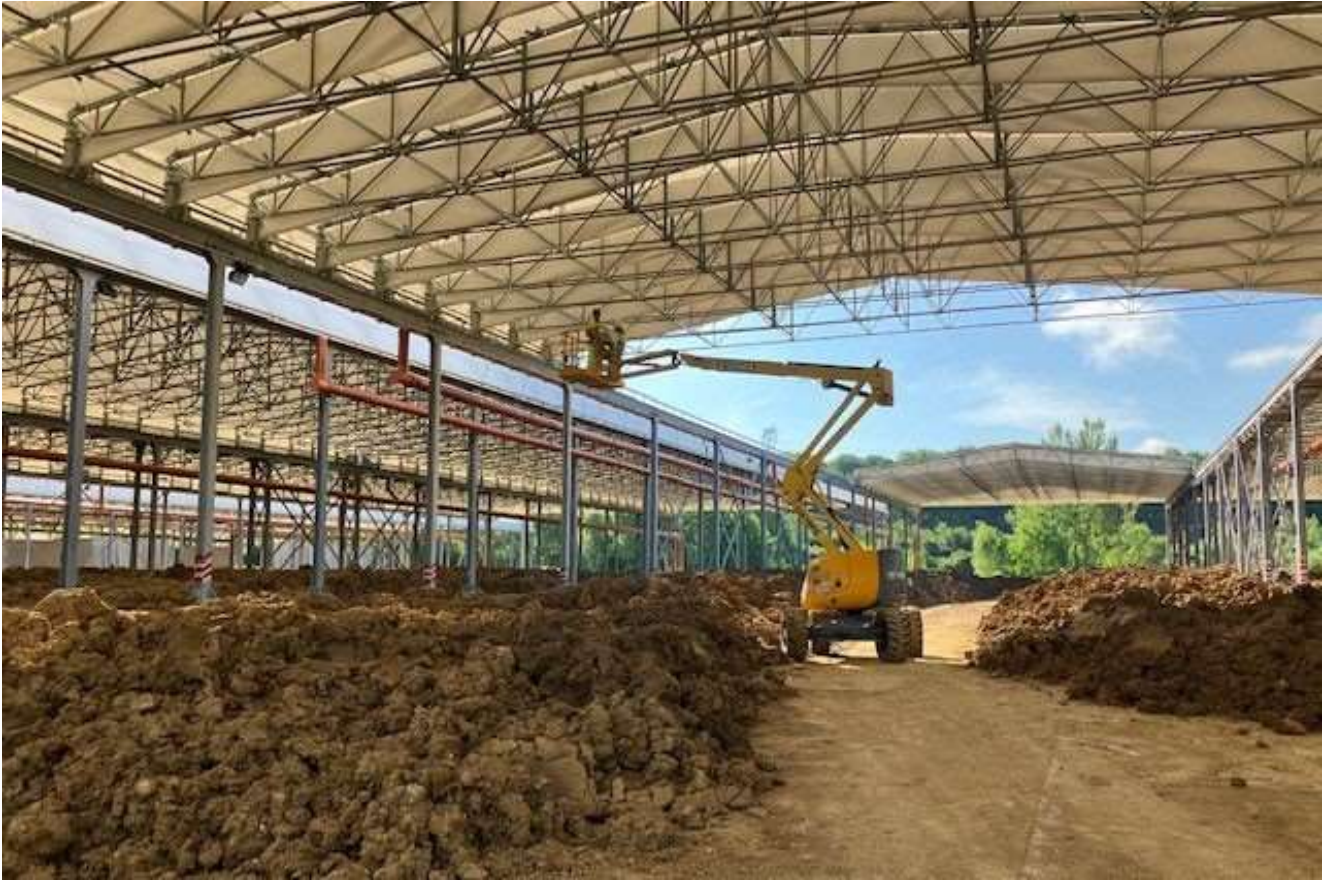
Figura 6 – Santa Barbara