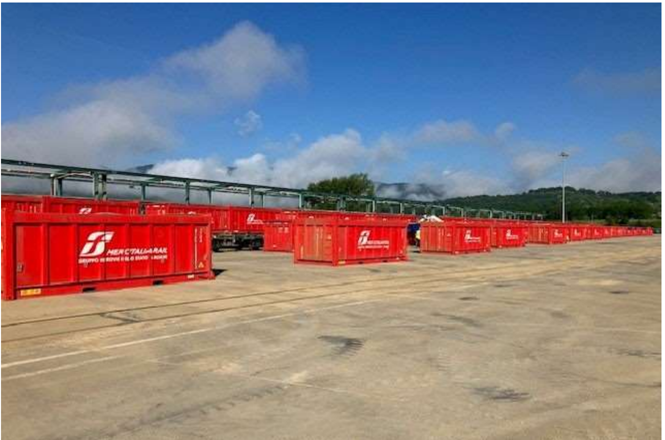
Figura 7 – Santa Barbara