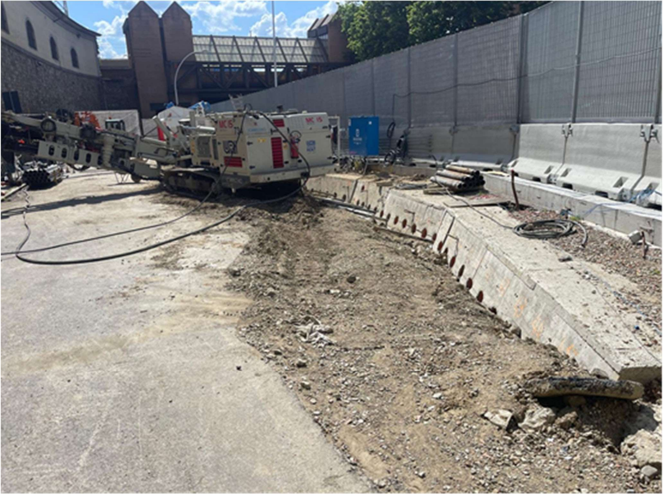
Figura 10 - Fortezza Area 3