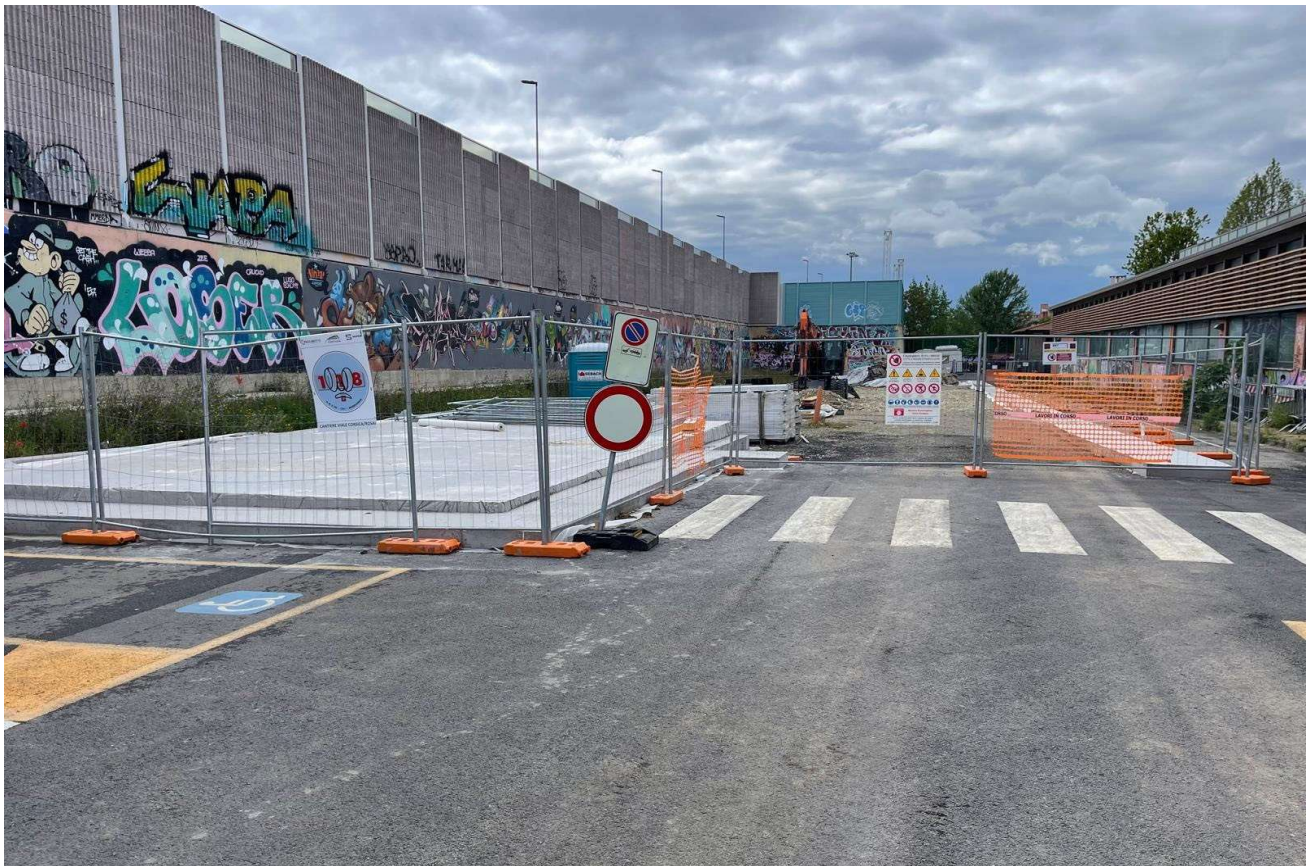
Figura 15 - Ottone Rosai