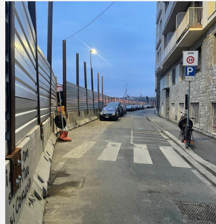
Via Cosseria Restringimento dell'area di cantiere