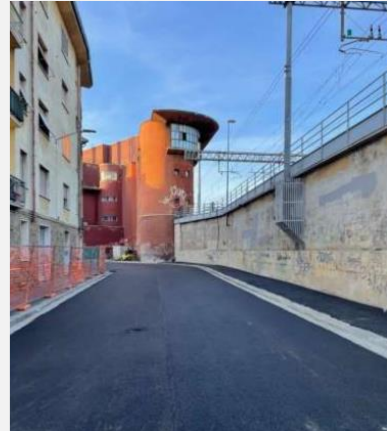
Via delle Ghiacciaie