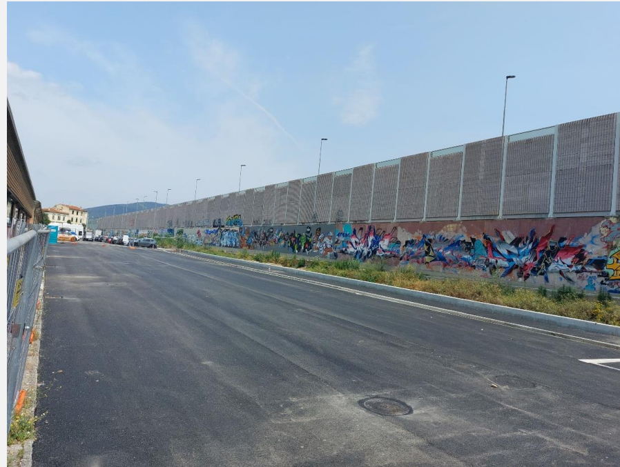
Scuola Ottone Rosai