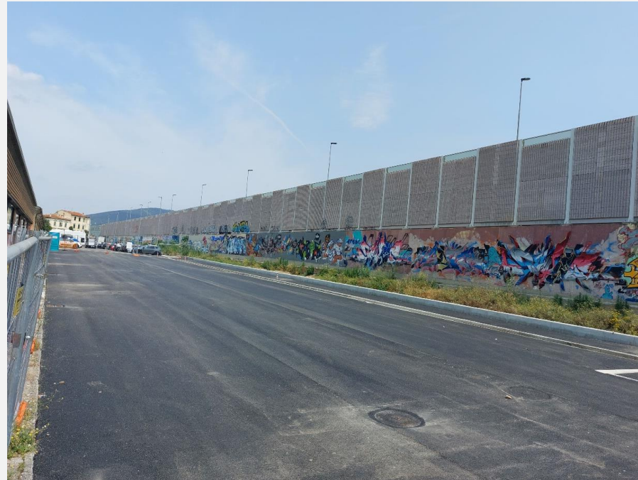
Scuola Ottone Rosai