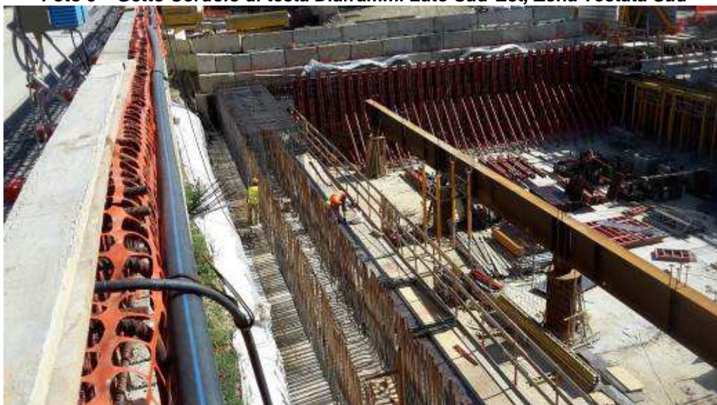
Foto 6 – Banchinaggio e montaggio armatura Cordolo di testa Diaframmi Lato Est, Zona T. Sud