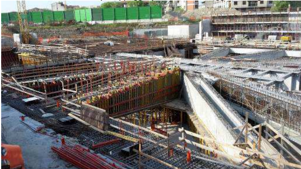
Foto 4 – Montaggio armatura, casseri e Getto Travi, Ventaglio Asse 33 - Lato Est