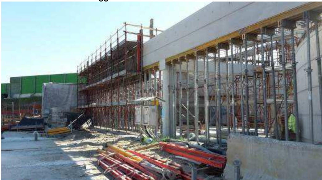
Foto 9 – Montaggio armatura, cassetatura e getto Trave T.01.C02A, Rampa Kiss&Ride