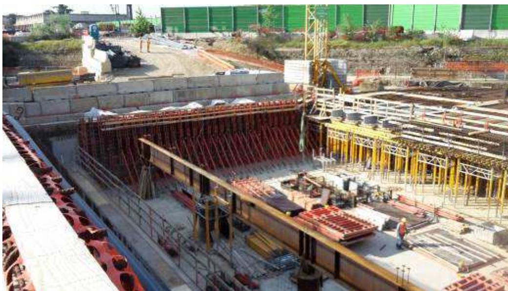
Foto 5 – Getto Cordolo di testa Diaframmi Lato Sud-Est, Zona Testata Sud