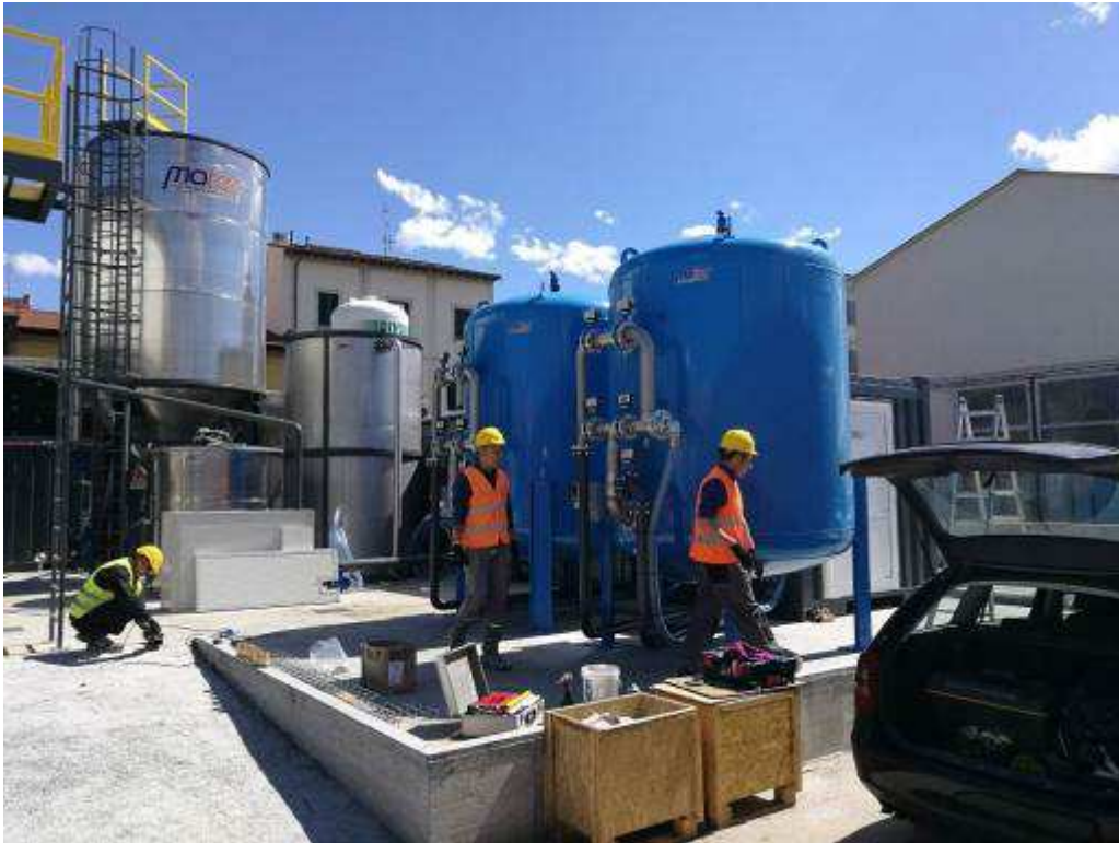
Foto 2 – Montaggio Nuovo Impianto Trattamento acque – Area Campo di Marte