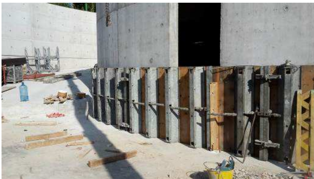
Foto 11 – Montaggio armatura, cassetta e getto Fascione Muro MU10, Rampa Kiss&Ride