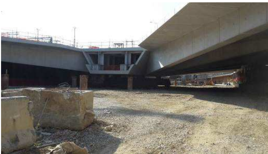
Foto 2 – Rimozione Platee per appoggio puntelli banchinaggio, Ventaglio Asse 17