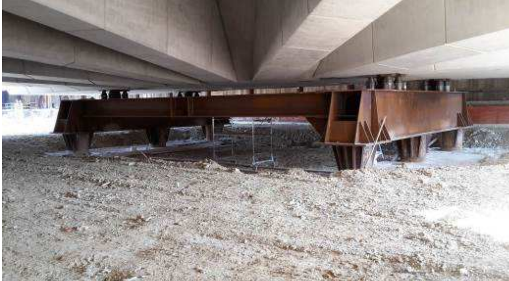
Foto 3 – Rimozione Platee per appoggio puntelli banchinaggio, Ventaglio Asse 25