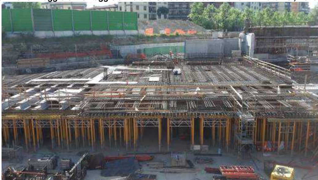
Foto 7 – Banchinaggio e Montaggio armatura Solaio liv. 00 Testata Sud - lato Ovest