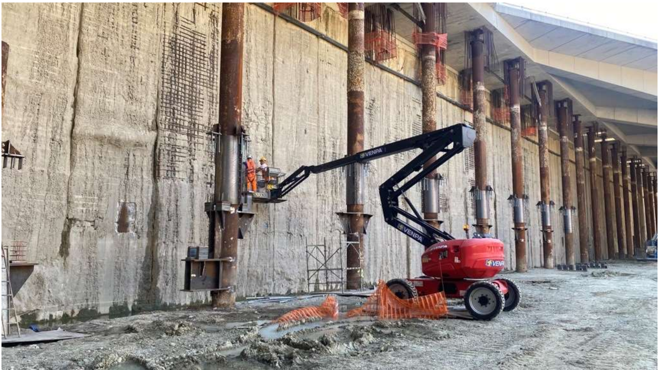
Figura 2 – Stazione AV