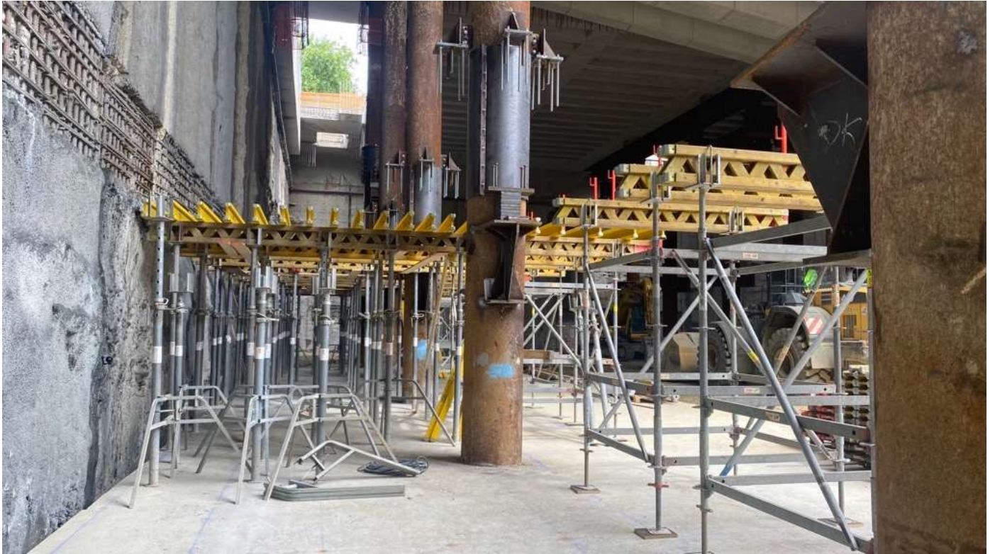
Figura 1 - Stazione AV