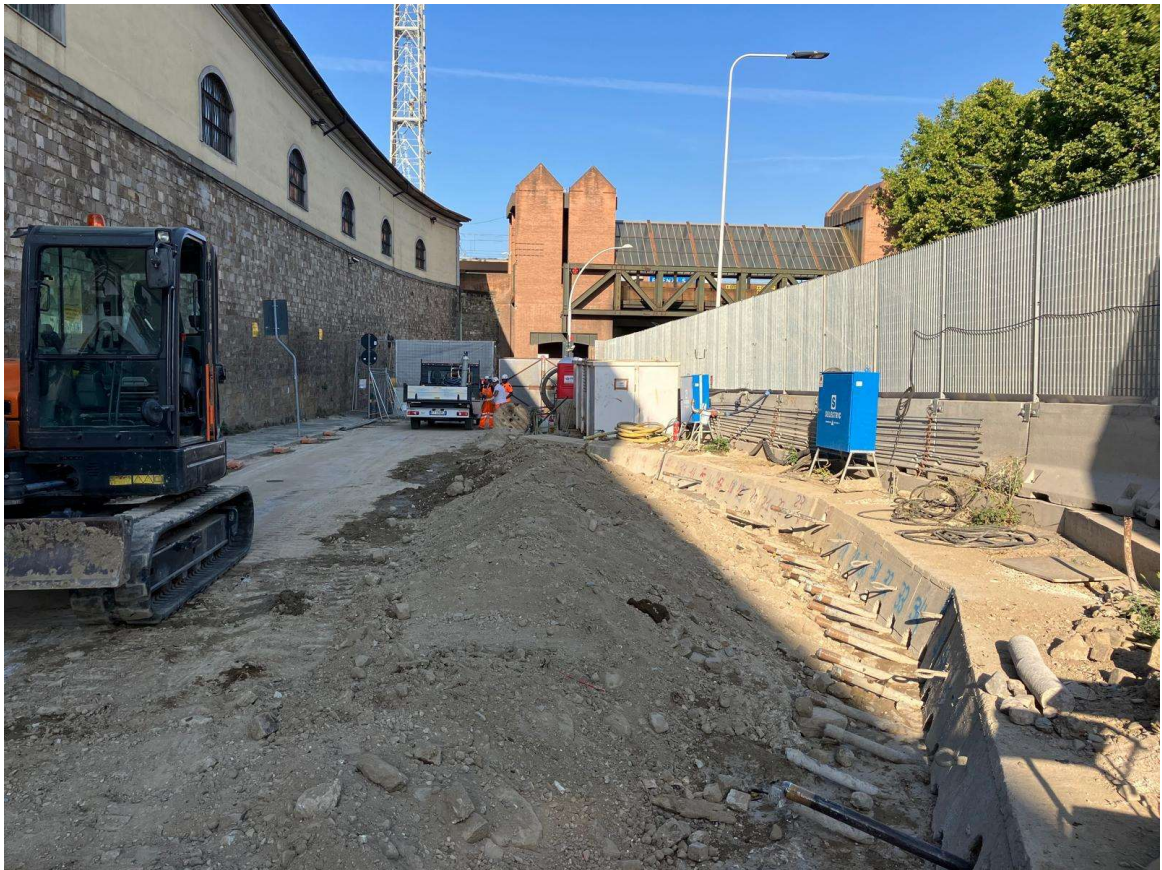
Figura 10 - Fortezza Area 3