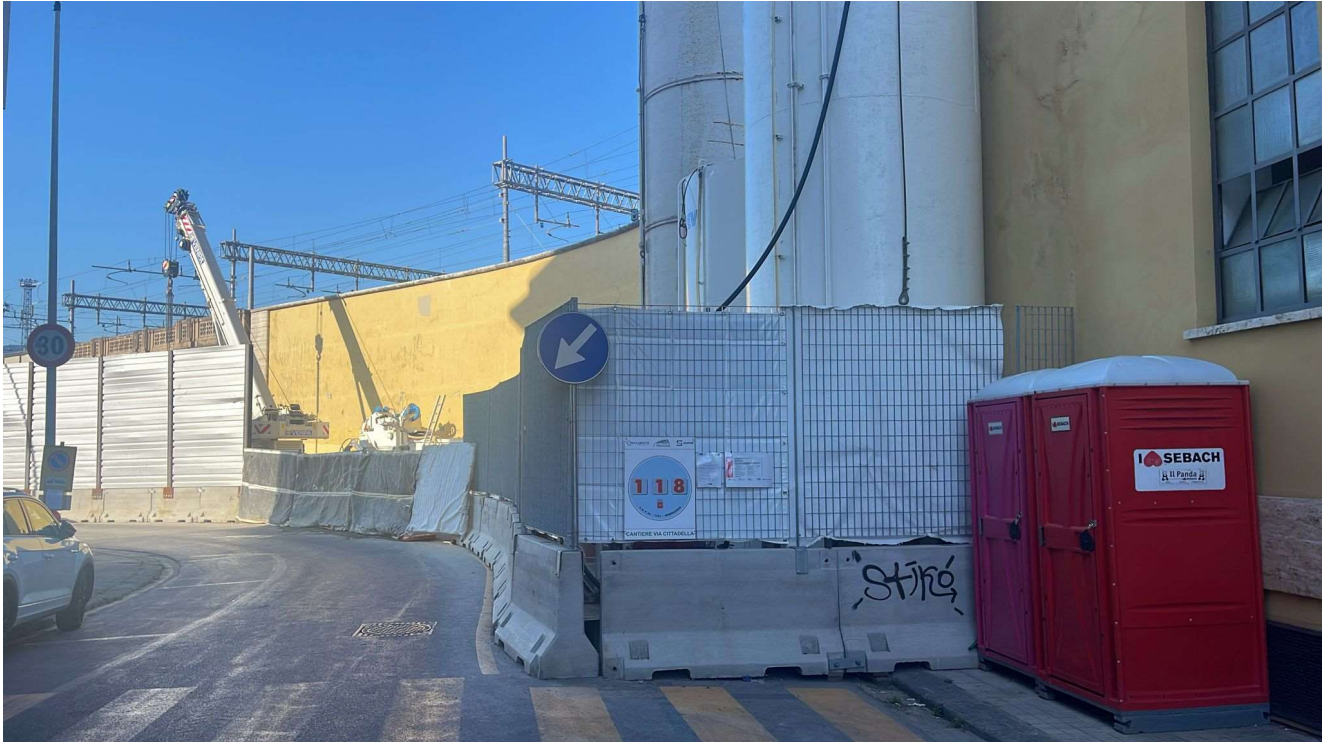
Figura 12 - Pozzo Via Cittadella