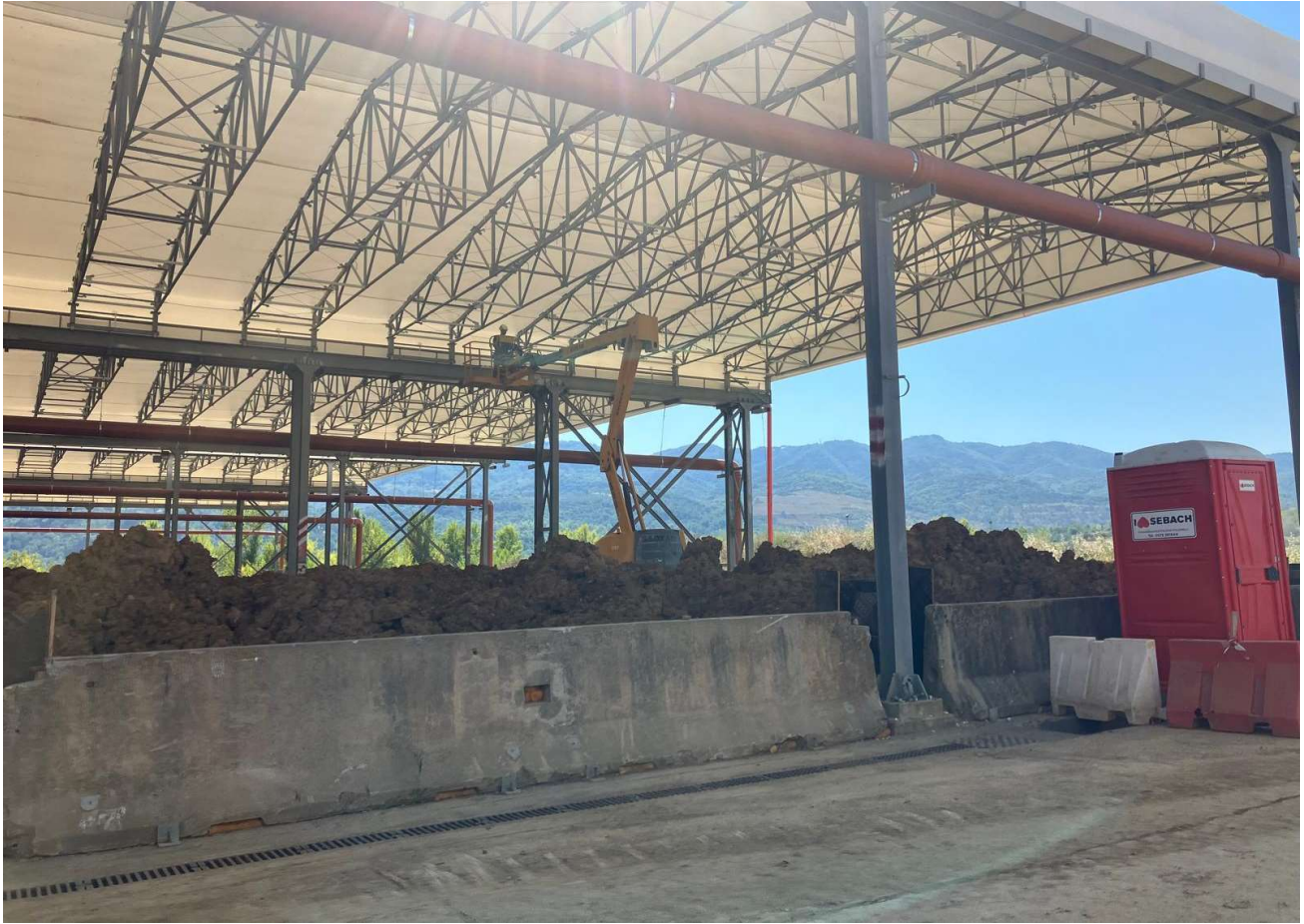
Figura 6 – Santa Barbara