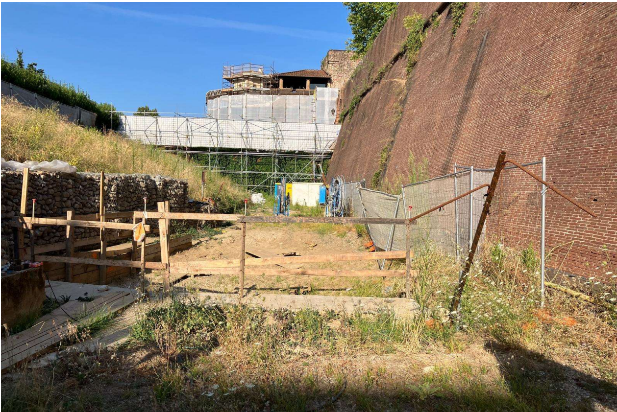
Figura 9 - Fortezza Area 2