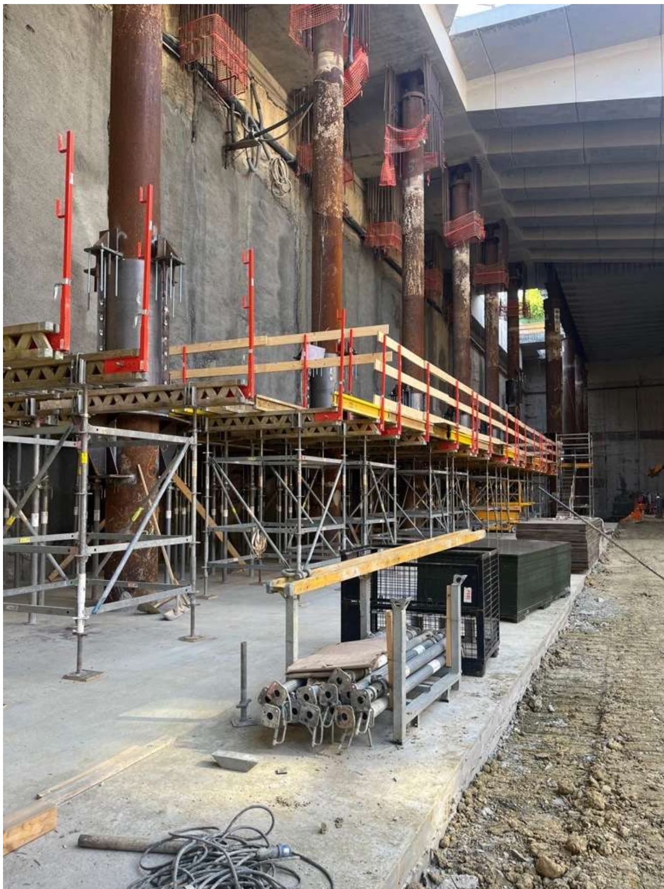
Figura 3 - Stazione AV