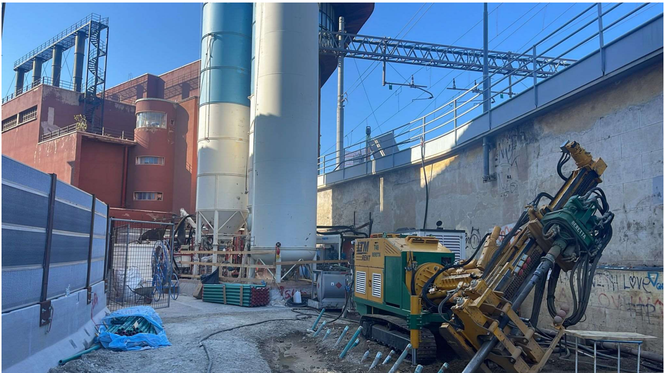
Figura 13 - Via delle Ghiacciaie