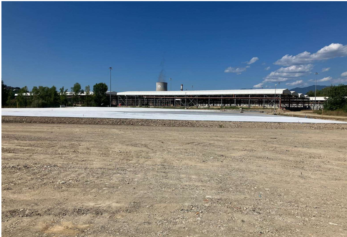
Figura 7 – Santa Barbara