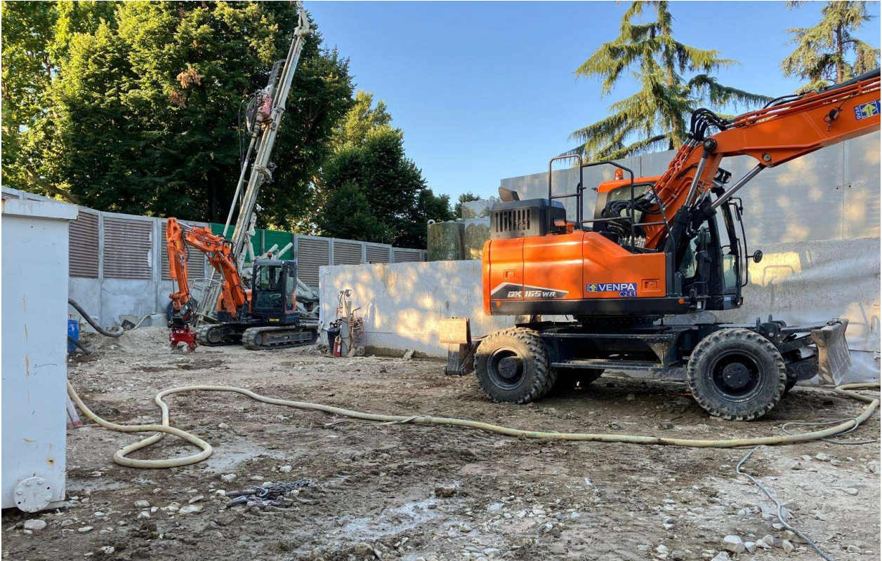
Figura 8 - Fortezza Area 1