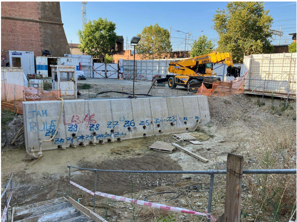
Figura 11 - Fortezza Area 4