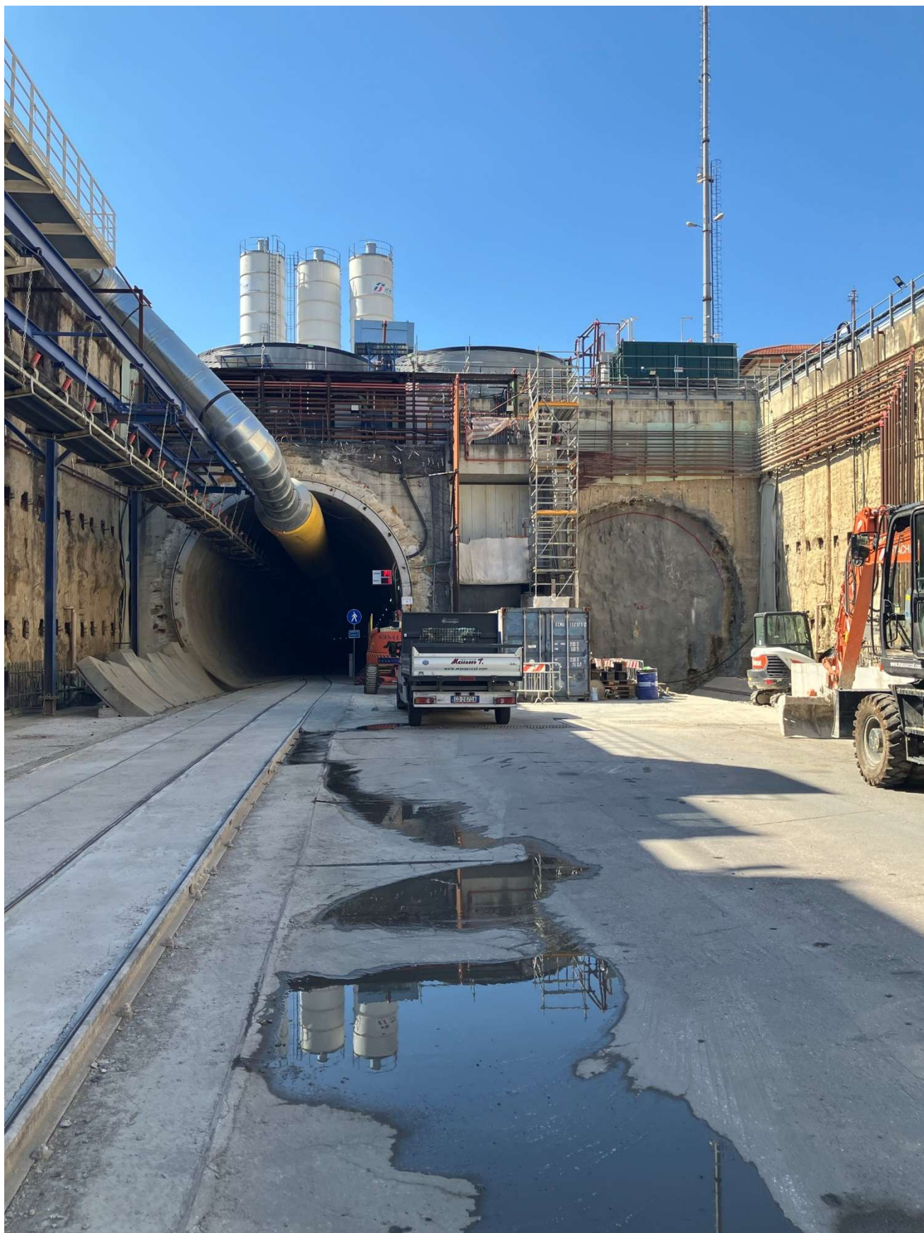
Figura 5 – Campo di Marte