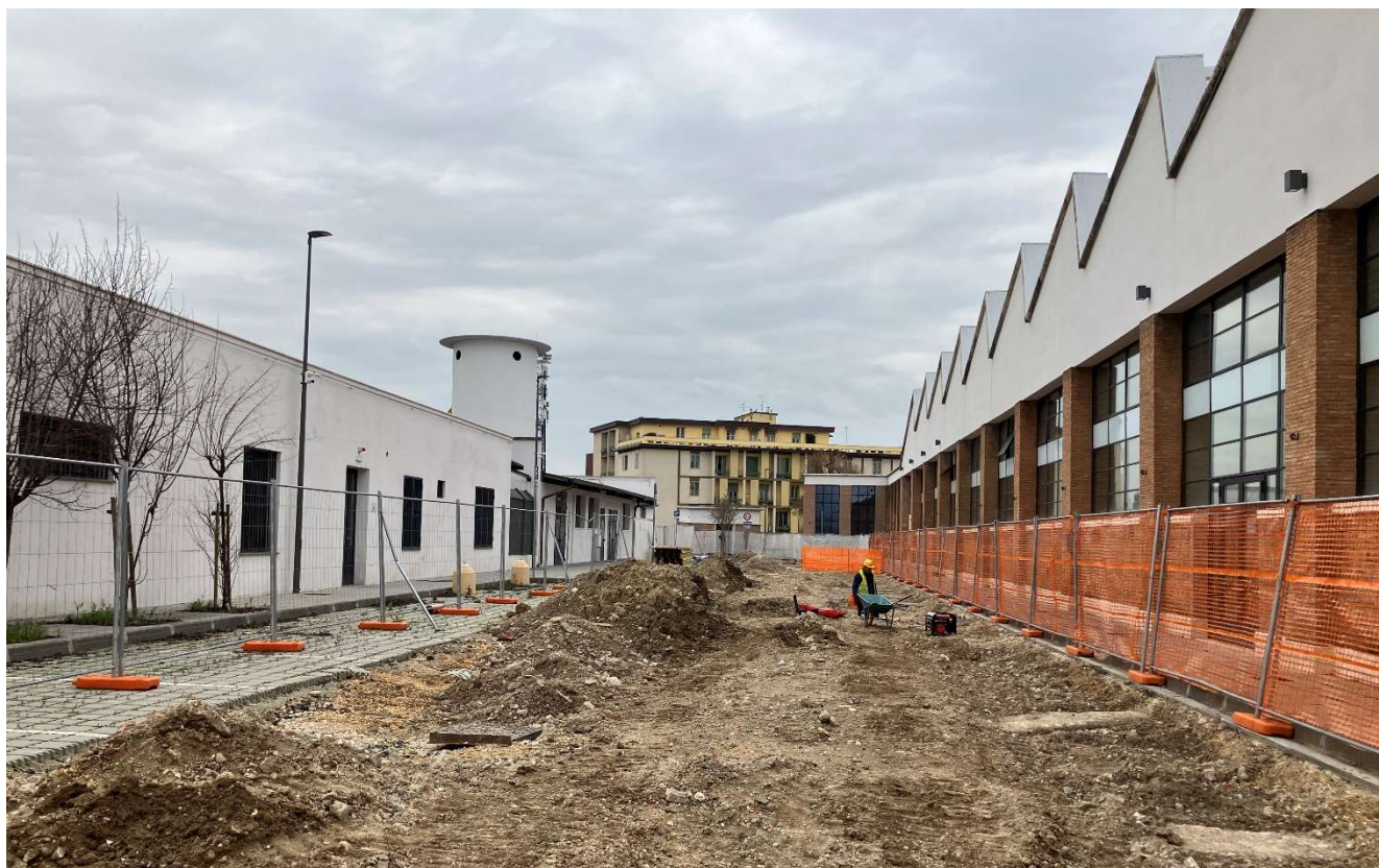
Figura 14 - Viale Redi