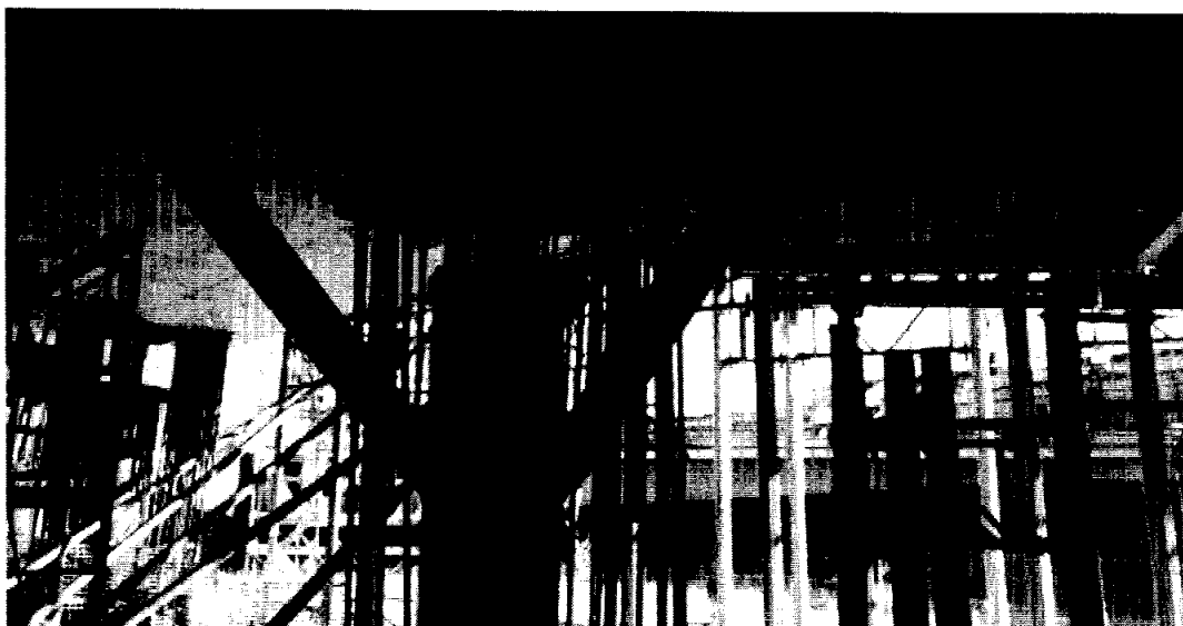
Foto 1 – Interventi di ripristino su trave cuscino ovest, Ventaglio33