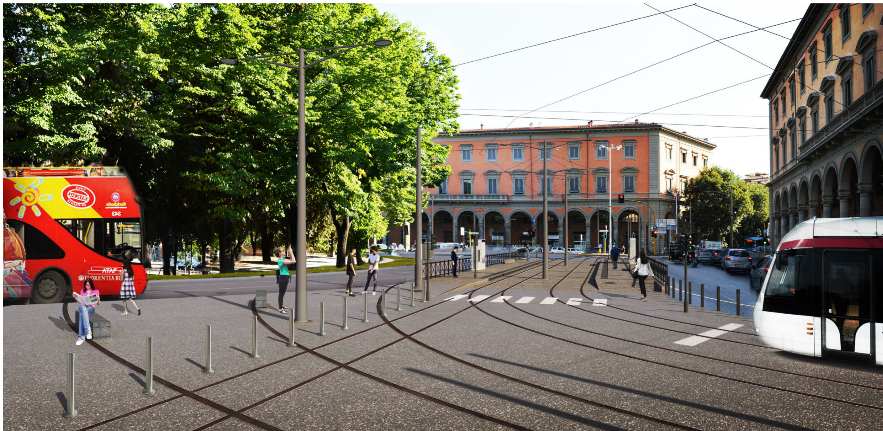
Piazza della Libertà | Render 1 - stato di progetto