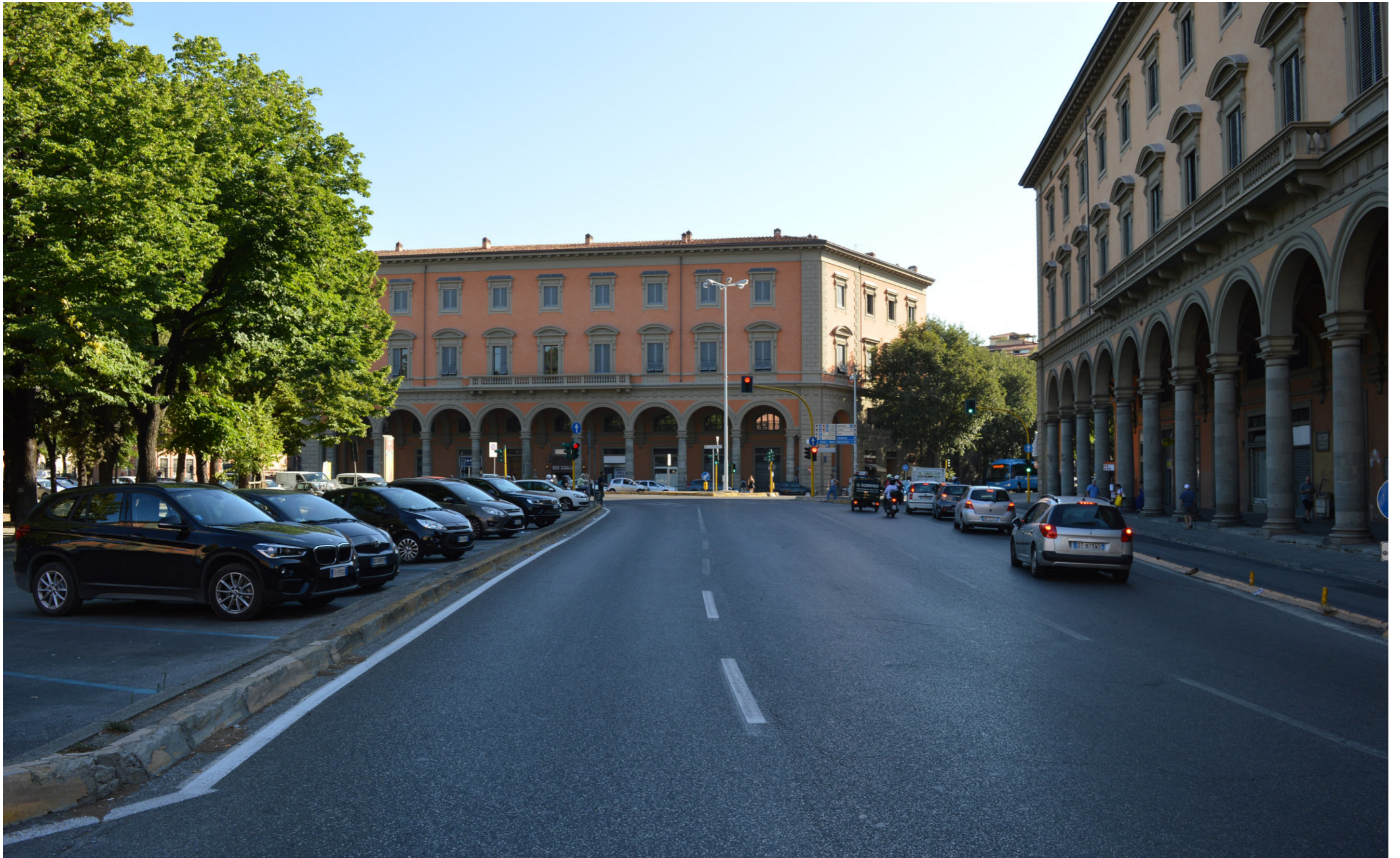
Piazza della Libertà | Foto 1 - stato attuale