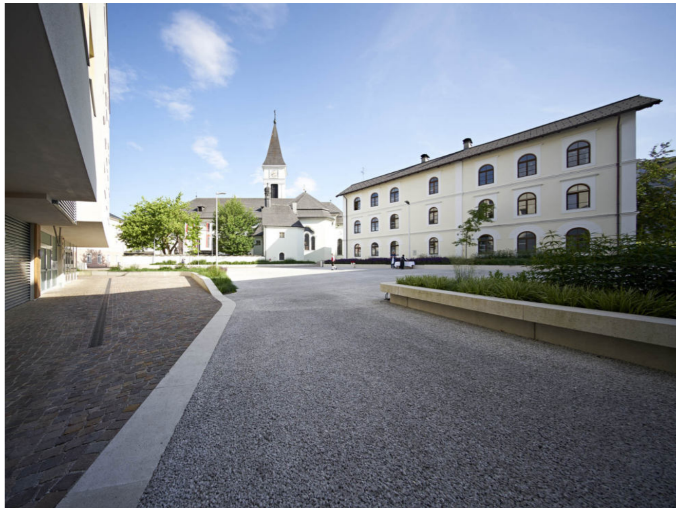
Piazza della Libertà | Materiali - stato di progetto