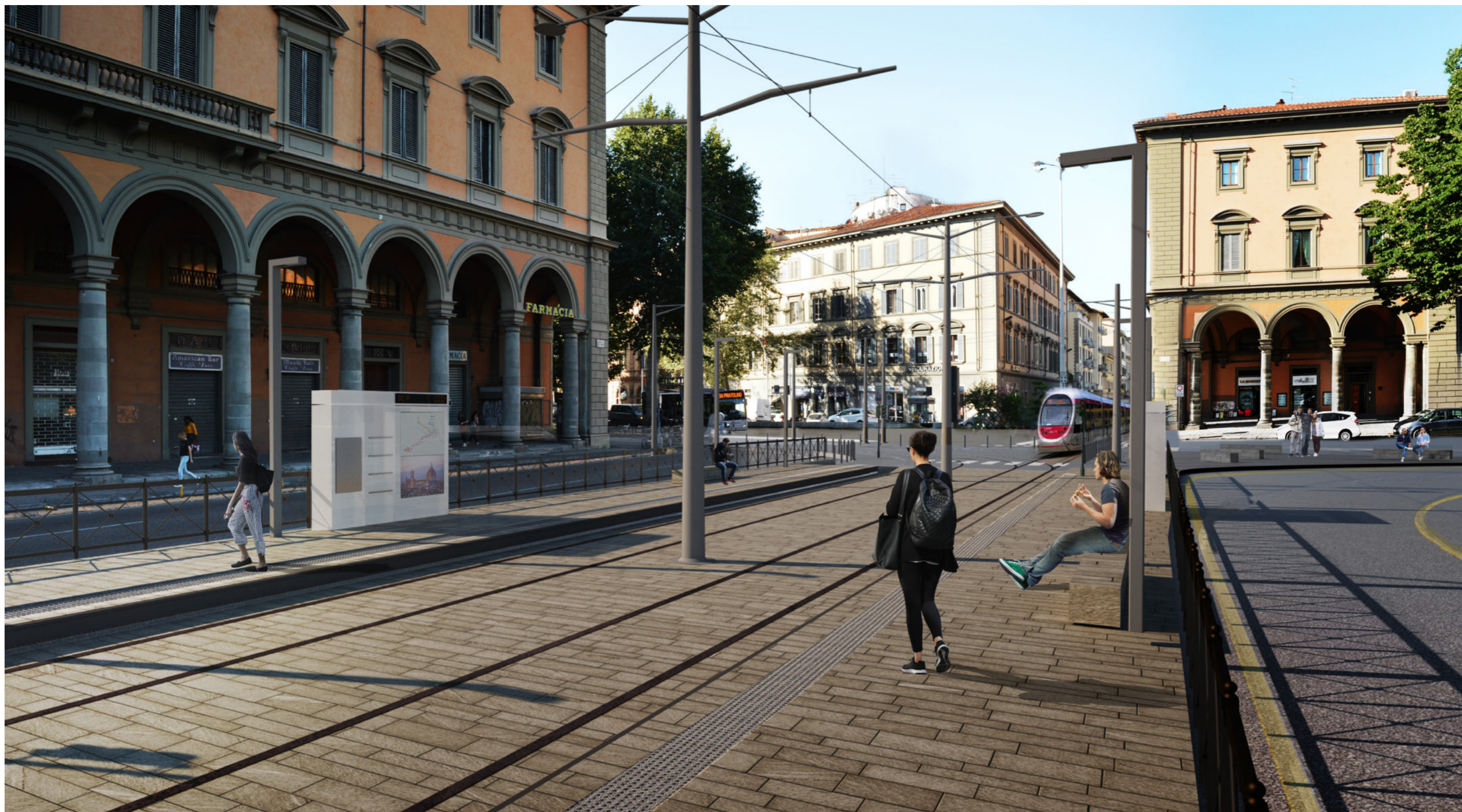
Piazza della Libertà | Render 2 - stato di progetto