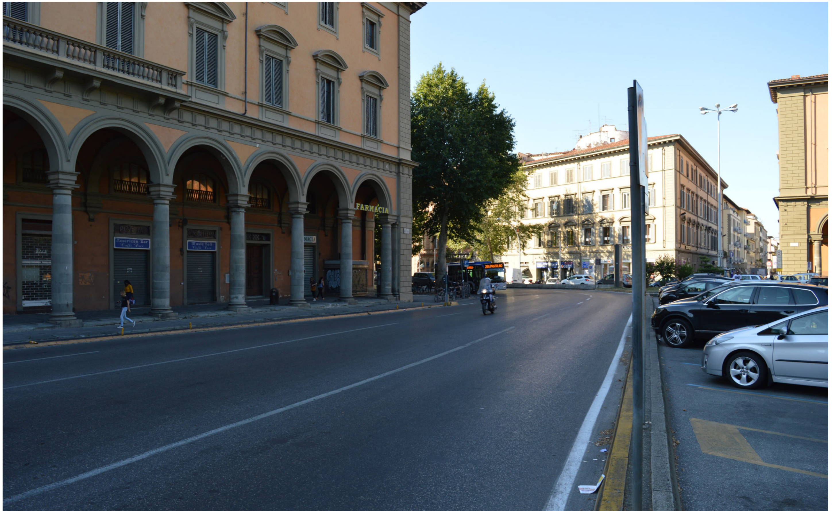
Piazza della Libertà | Foto 2 - stato attuale