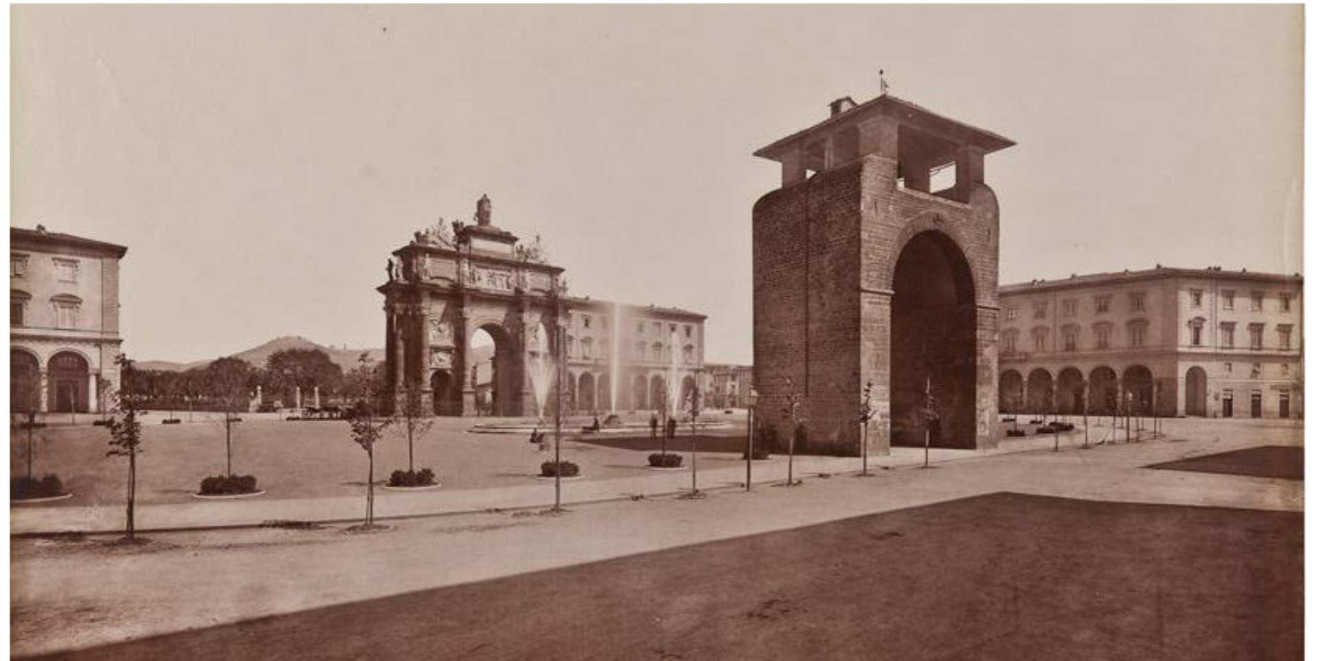
Piazza della Libertà | Foto storiche