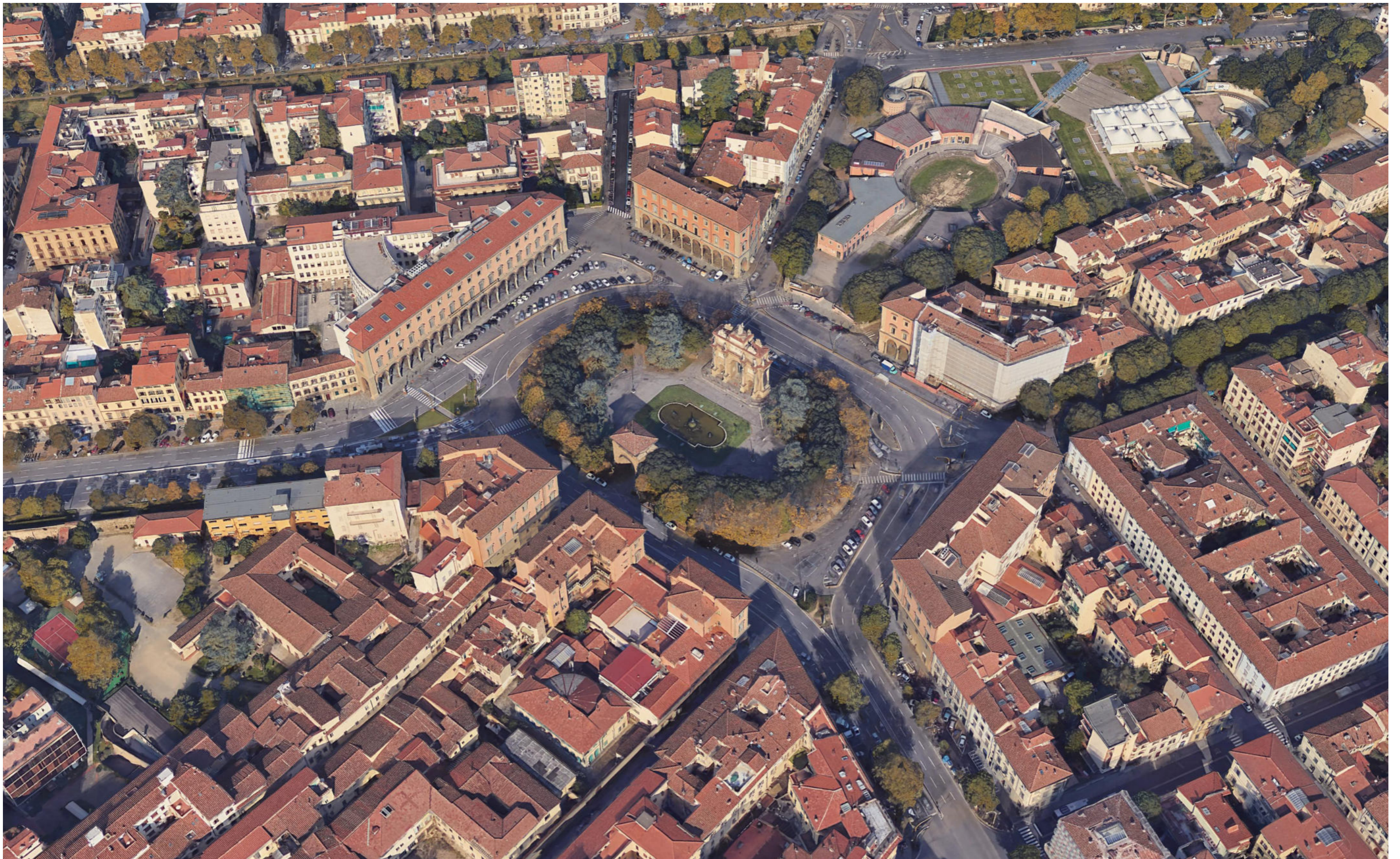
Piazza della Libertà | Foto aerea stato attuale