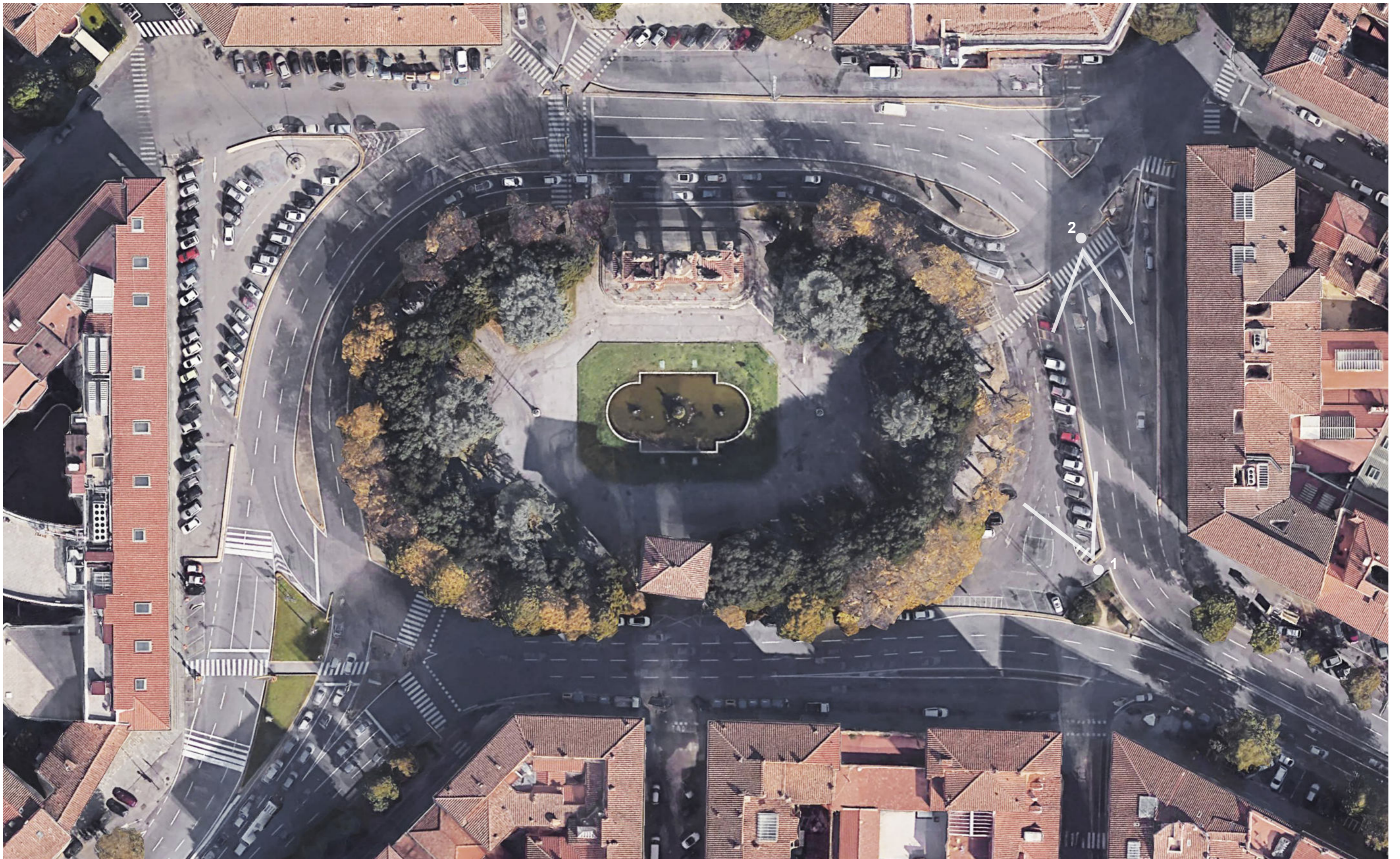
Piazza della Libertà | Foto aerea stato attuale