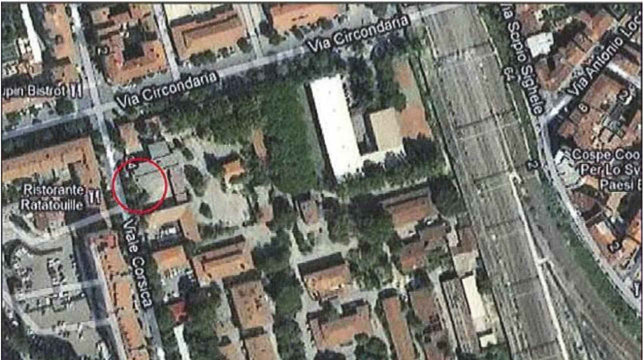
Allegato 1: Passo carrabile via di fuga Viale Corsica