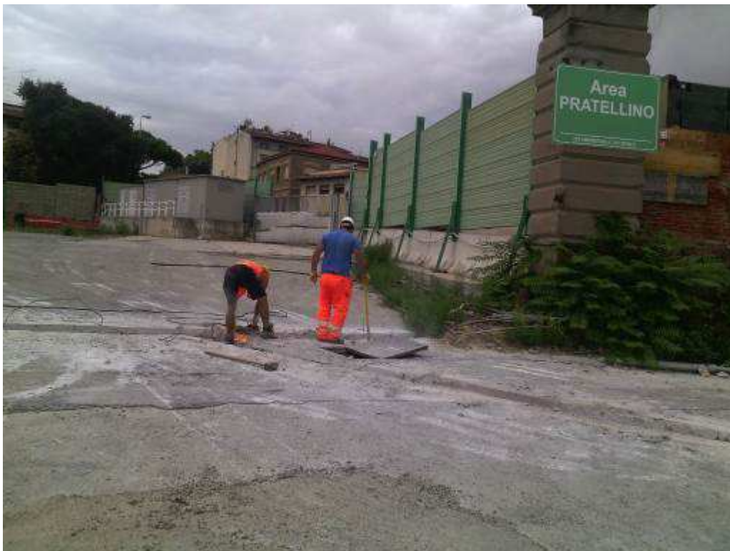
Foto 5 - Regimazione acque al di sopra del pozzo lancio Fresa