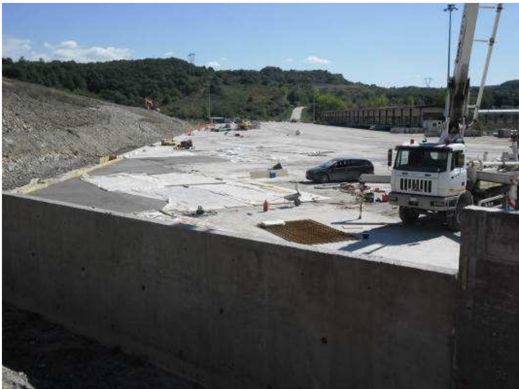
Foto 7 - Completamento Terminal Bricchette