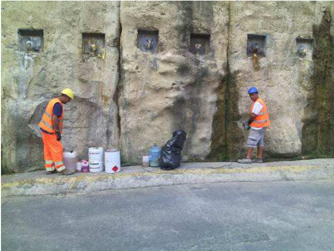
Foto 6 - Interventi per risoluzione nc 122