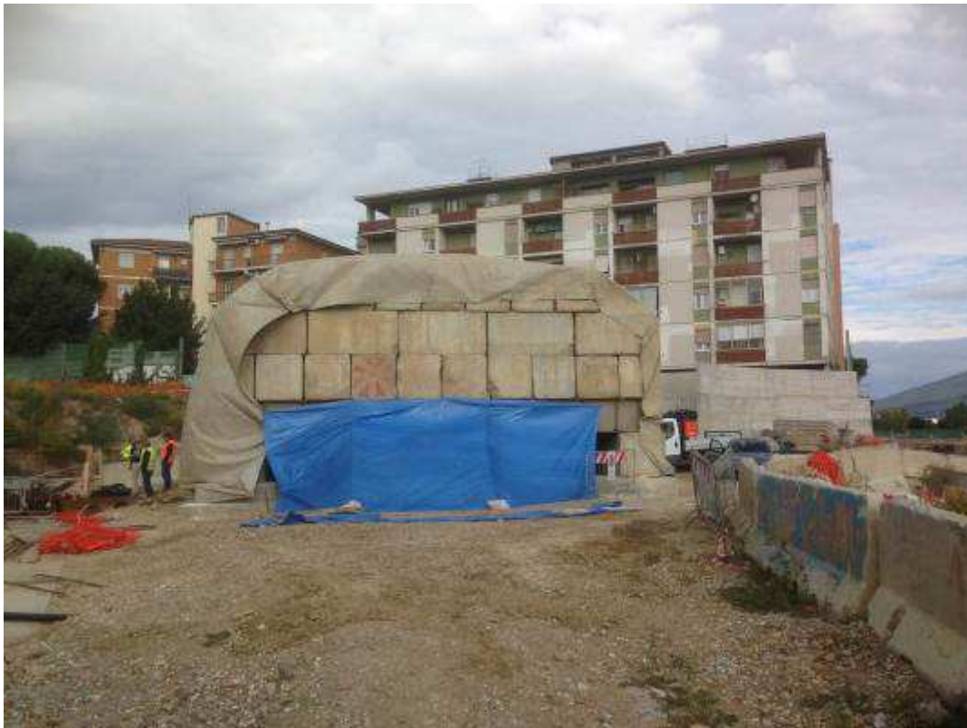
Foto 3 - Prove di carico su pali fondazione rampa Kiss&Ride