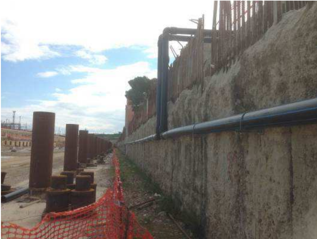
Foto 2 - Impianto di aggottamento acque interno camerone