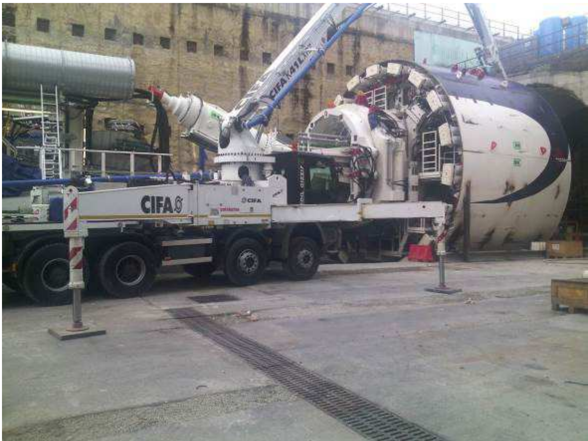
Foto 3 - Carpenteria e getto per preparazione imbocco