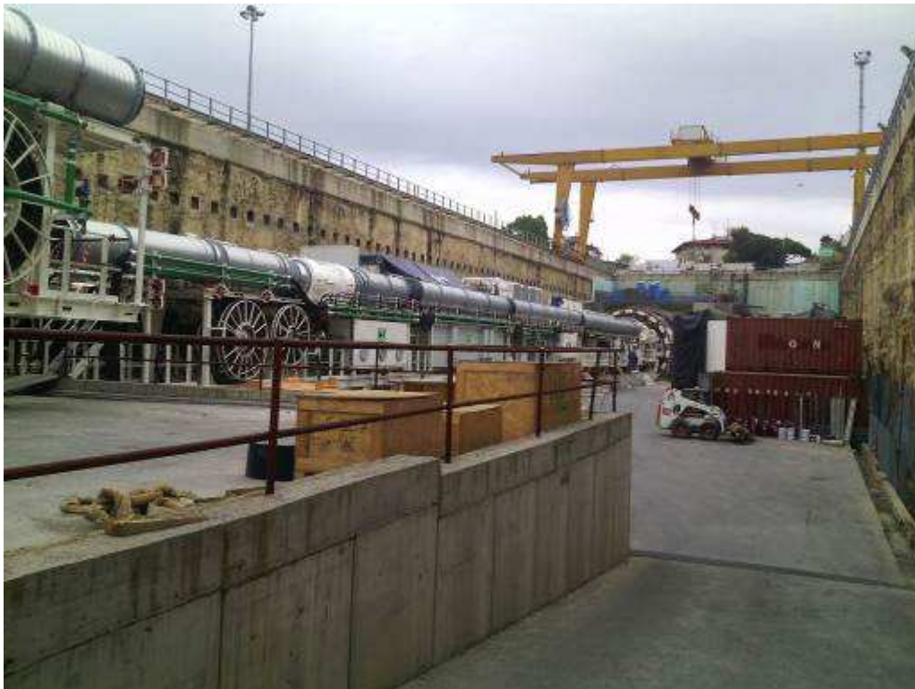
Foto 2 - Montaggio TBM