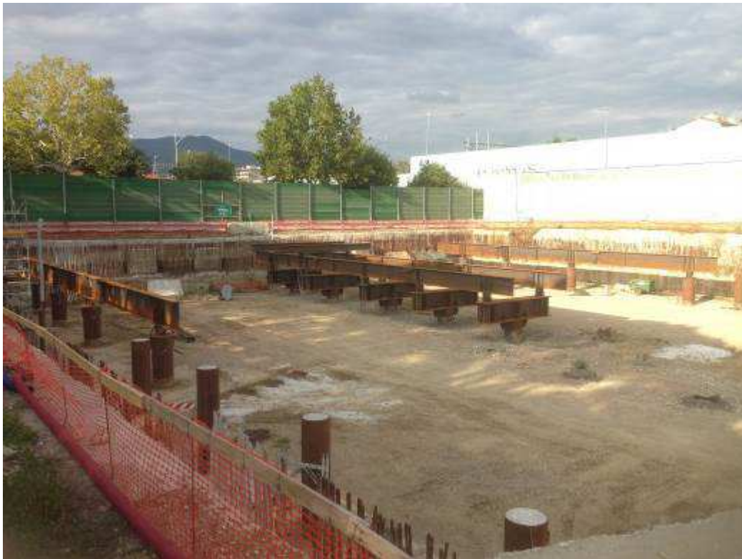
Foto 1 - Posa carpenterie metalliche a sostegno Solaio Piano Terra pressi testata Nord