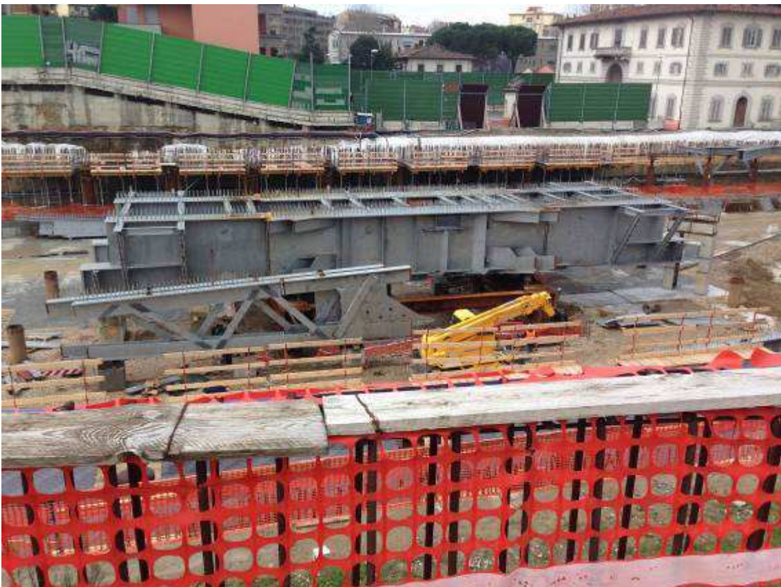
Foto 3 – Montaggio carpenterie metalliche Solaio Piano Terra - Cassone asse 25