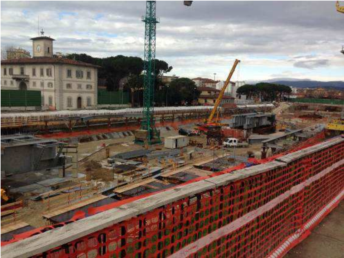
Foto 2 – Montaggio carpenterie metalliche Solaio Piano Terra - Cassone asse 17