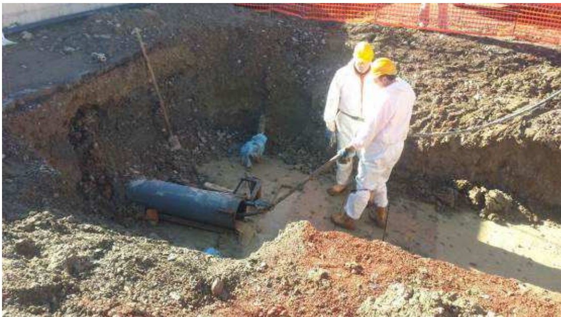
Foto 5 – Risoluzione interferenza antincendio Enel - Svuotamento tubazione con Canal-Jet