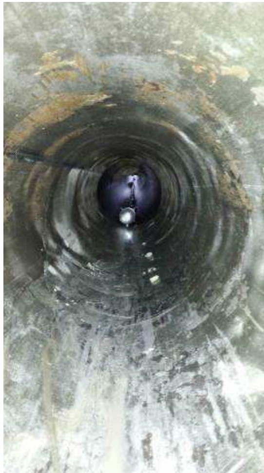
Foto 6 – Risoluzione interferenza antincendio Enel - Svuotamento tubazione con Canal-Jet