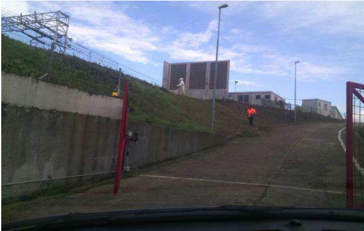
Foto 4 - Sfalcio campo base Rovezzano