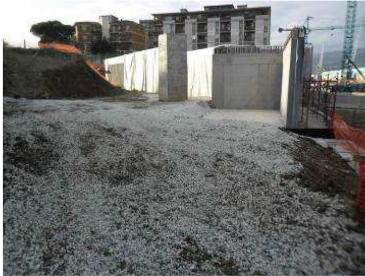
Foto 8 – Realizzazione vasca di accumulo acque meteoriche presso la Rampa K&R