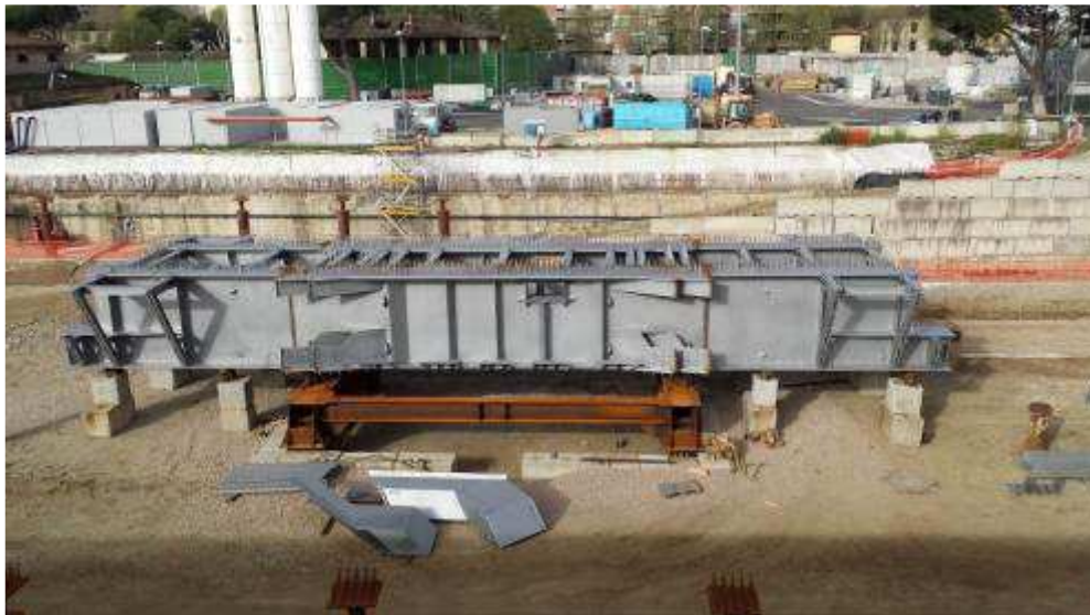
Foto 2 – Montaggio carpenterie metalliche Solaio Piano Terra – Cassone asse 9