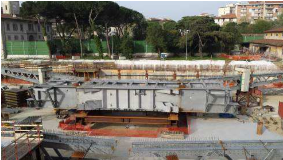
Foto 3 – Montaggio carpenterie metalliche Solaio Piano Terra – Cassone asse 17