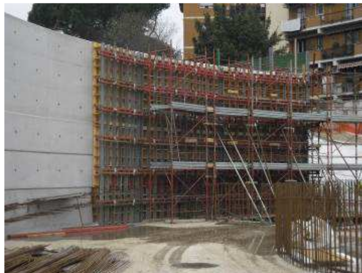
Foto 7 – Realizzazione elevazione Rampa K&R