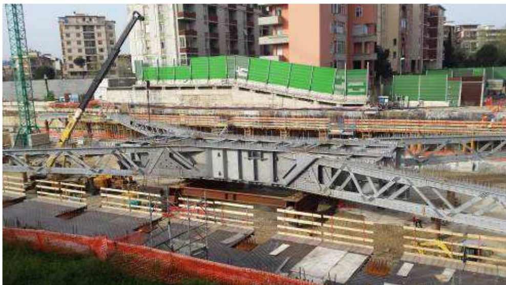
Foto 4 – Montaggio carpenterie metalliche Solaio Piano Terra – Ventaglio asse 25