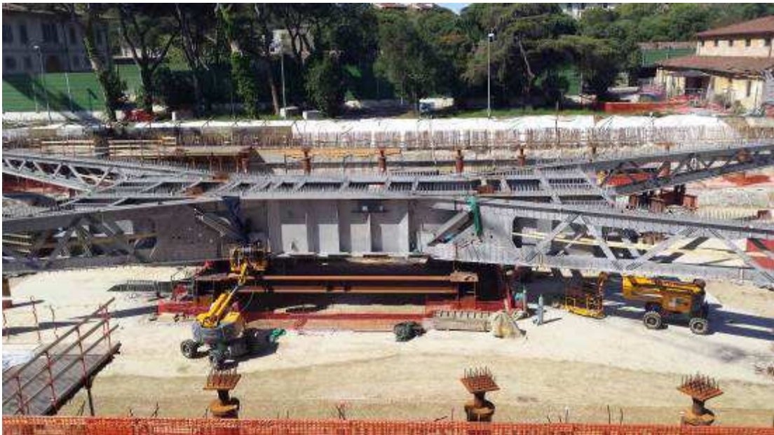
Foto 5 – Montaggio carpenterie metalliche Solaio Piano Terra – Ventaglio asse 25