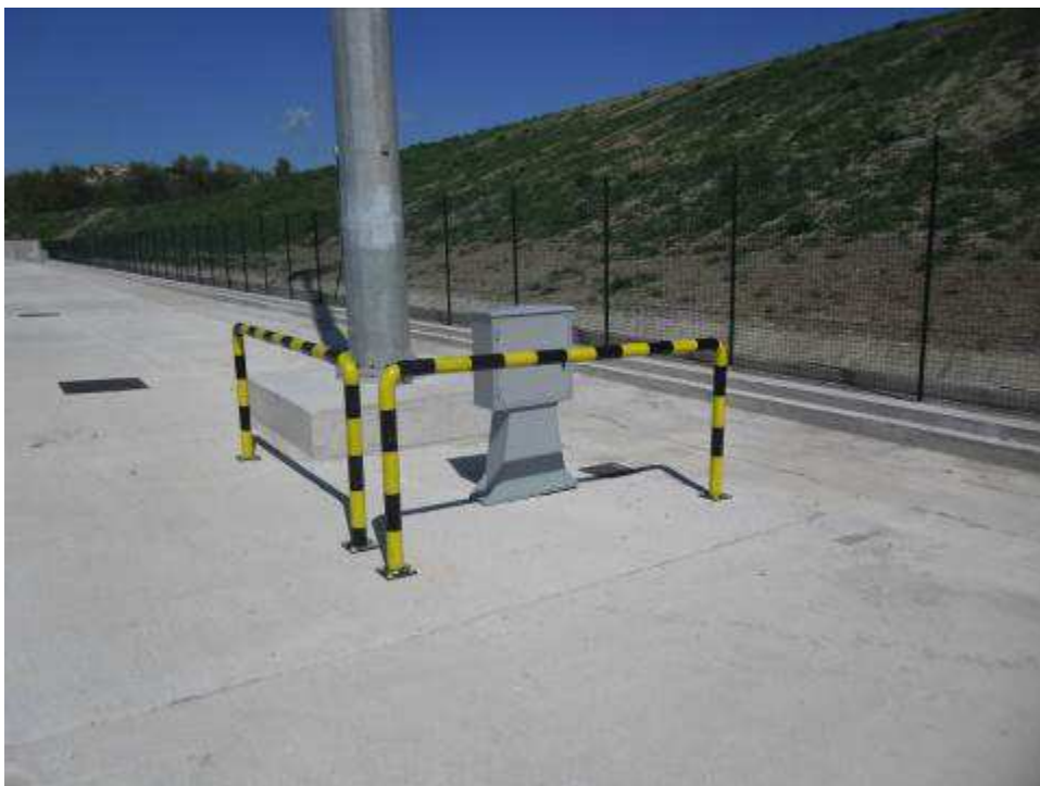
Foto 3 - Risoluzione NC Torri Faro Terminal Bricchette