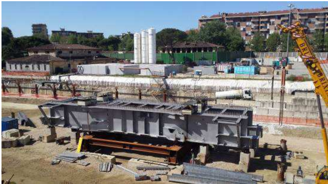
Foto 3 – Montaggio carpenterie metalliche Solaio Piano Terra – Cassone asse 9