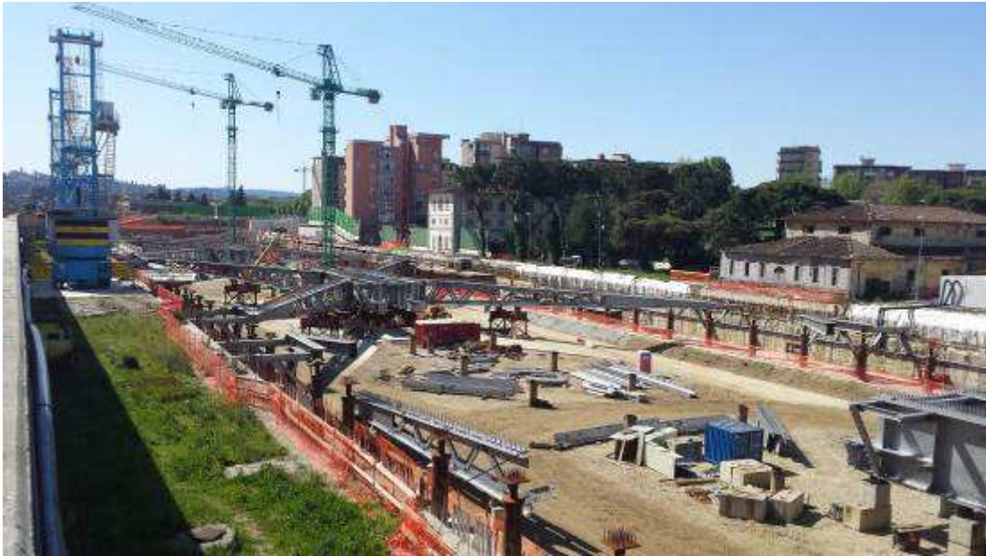
Foto 4 – Montaggio carpenterie metalliche Solaio Piano Terra – Cassone asse 17