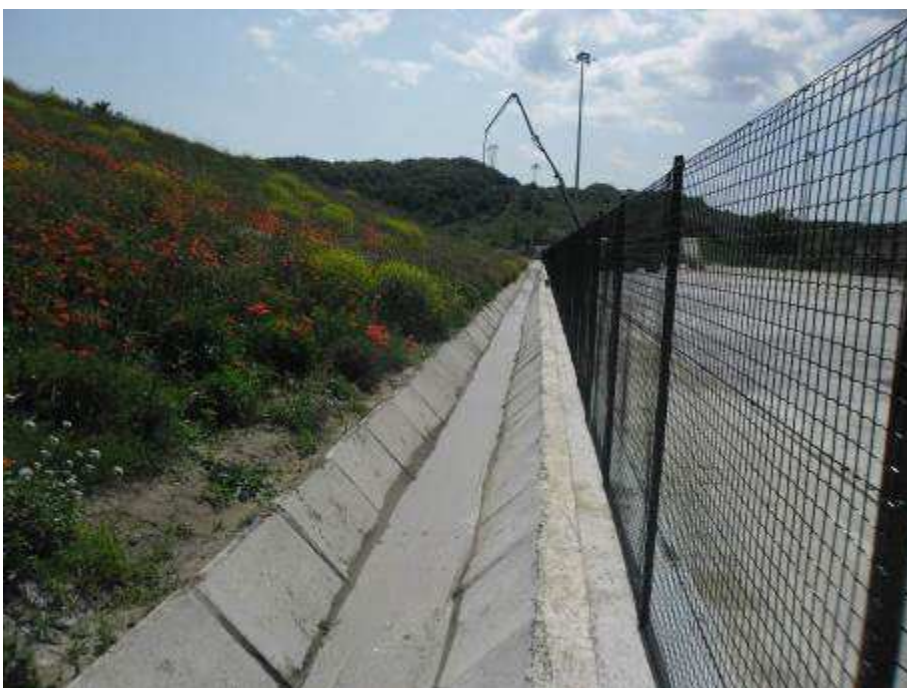
Foto 2 – Interventi per la Risoluzione della NC249 – Regolarizzazione scorrimento canaletta trapezia