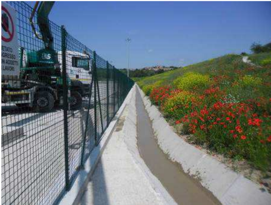
Foto 1 – Interventi per la Risoluzione della NC249 – Regolarizzazione scorrimento canaletta trapezia