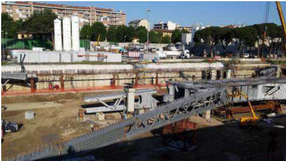
Foto 4 – Montaggio carpenterie metalliche Solaio Piano Terra – Ventaglio asse 9