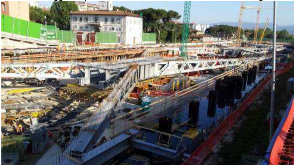
Foto 5 – Banchinaggio e Montaggio armatura Trave cuscino Fili 21-29