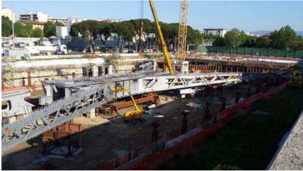
Foto 3 – Montaggio carpenterie metalliche Solaio Piano Terra – Cassone asse 9