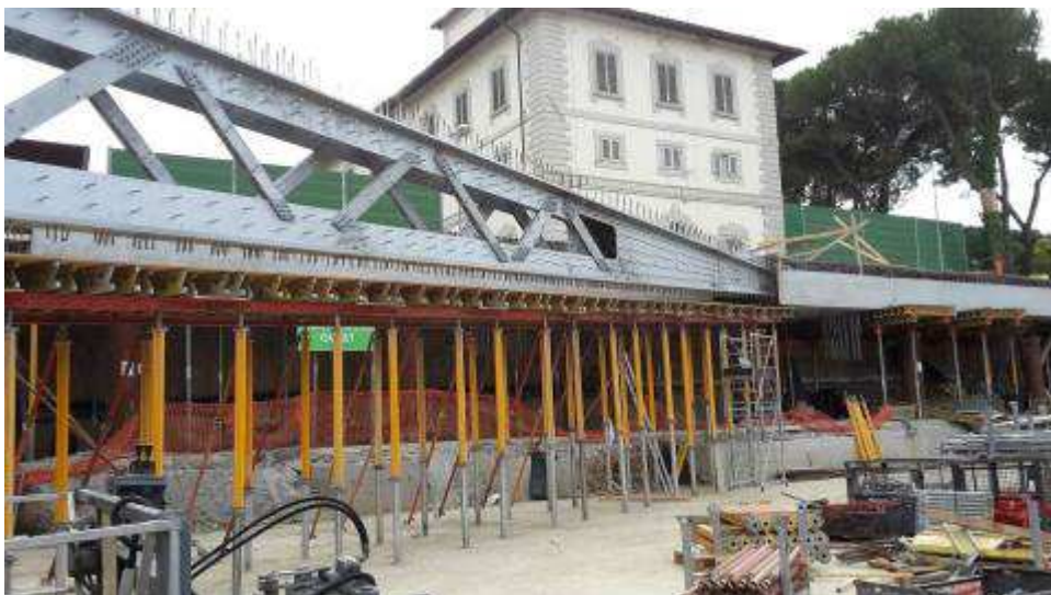
Foto 10 – Banchinaggio Travi lunghe-lato Ovest, Ventaglio Asse 25