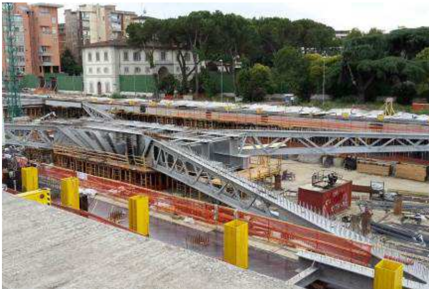
Foto 6 – Banchinaggio e Posa armatura Trave cuscino Fili 13-21 lato Est