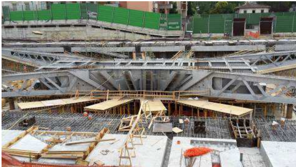
Foto 9 – Banchinaggio Travi intermedie e corte-lato Est, Ventaglio Asse 25