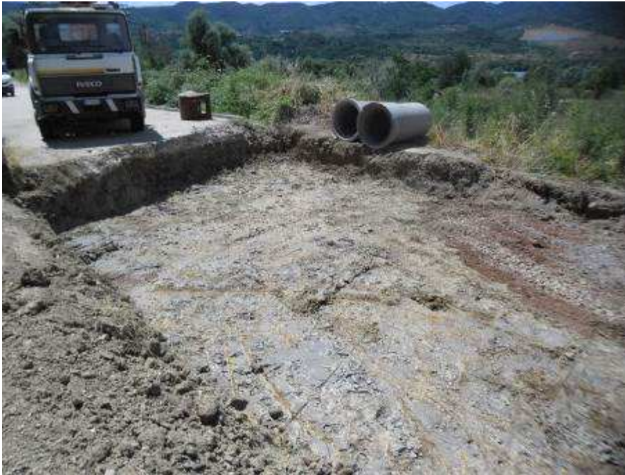
Foto 1 – Interventi per la Risoluzione della NC171 – Viabilità di Servizio