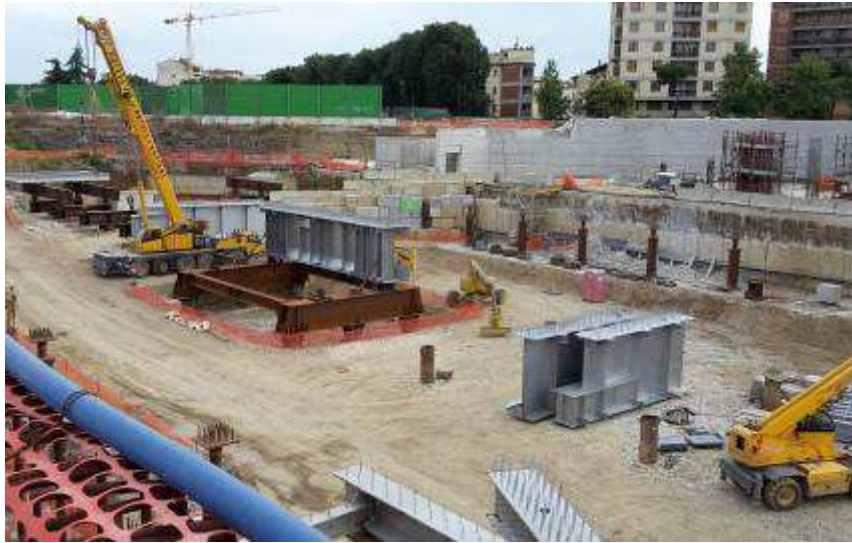
Foto 11 – Montaggio Cassone Ventaglio Asse 33 e Carpenterie Testata Sud