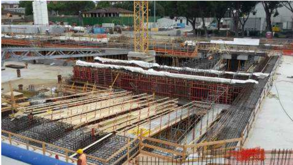
Foto 2 – Banchinaggio e montaggio armatura Cassone centrale e travi Fili 4-5