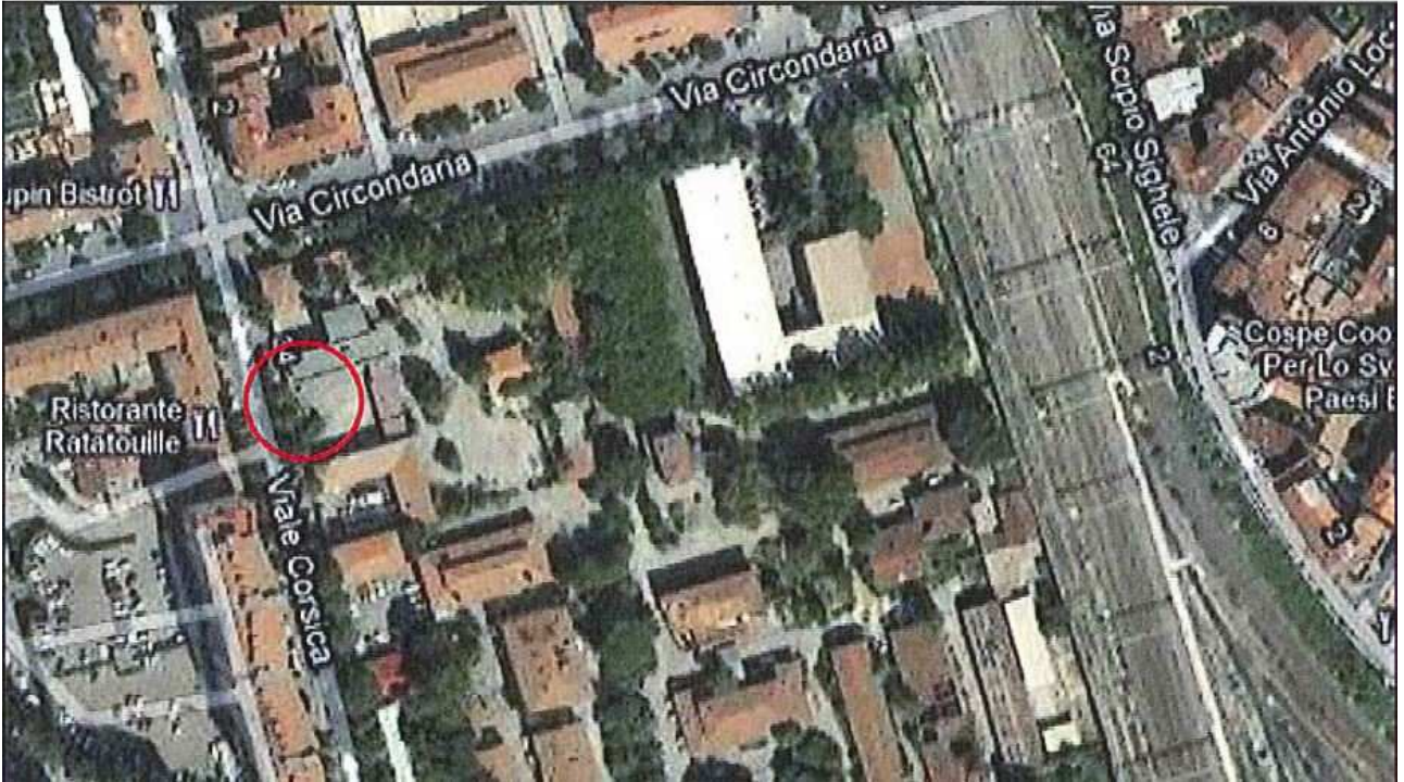
Allegato 1: Passo carrabile via di fuga Viale Corsica