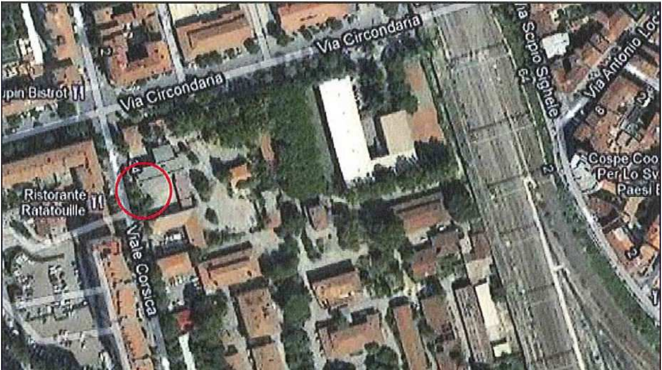
Allegato 1: Passo carrabile via di fuga Viale Corsica