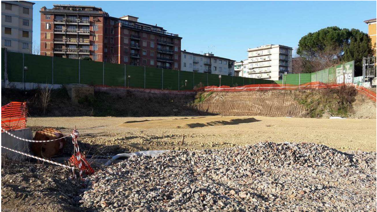
FOTO 2 – Preparazione piano di lavoro per realizzazione pali Rampa kiss&ride