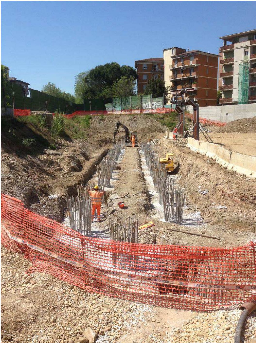
FOTO 2– Interventi preliminari alla realizzazione della fondazione rampa Kiss&Ride