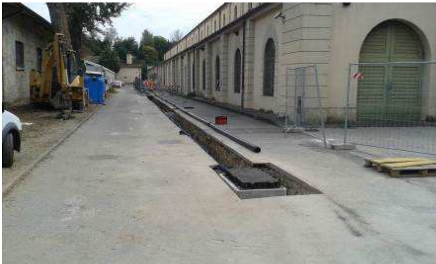
Foto 1 – Fortezza da Basso – Cavidotto per impianti Nuovo Pozzo Opificio delle Pietre Dure