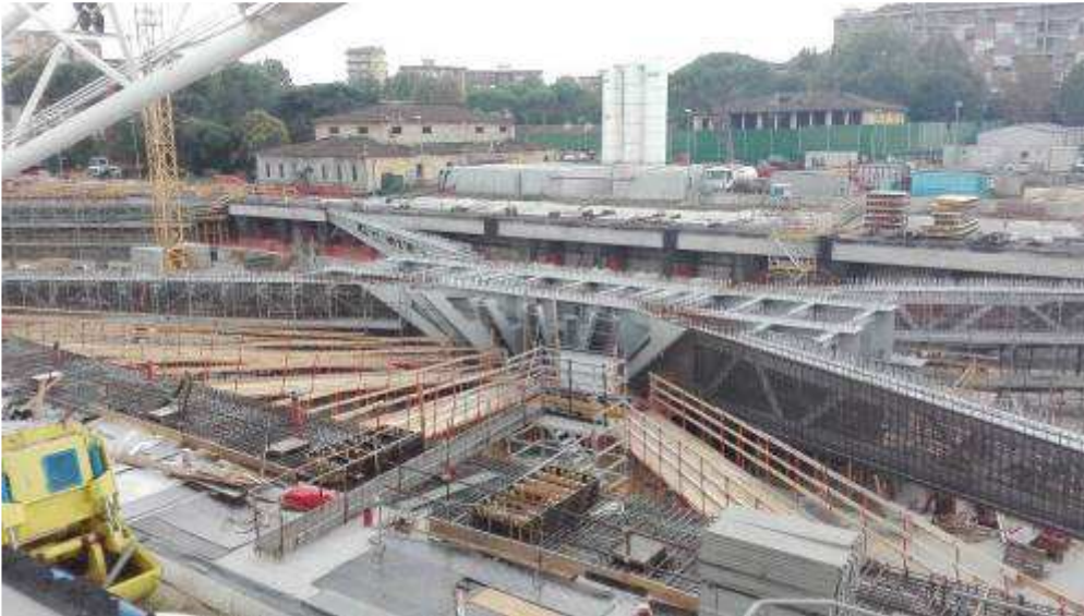
Foto 2 – Banchinaggio Travi intermedie e corte lato Est, Ventaglio Asse 9