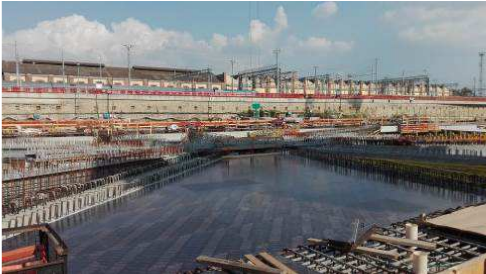
Foto 8 – Inizio montaggio casseri per Solaio lato Ovest, Ventaglio Asse 25