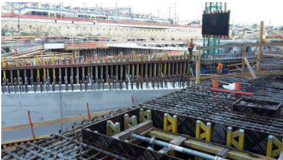
Foto 7 – Montaggio casseri Travi lunghe lato Ovest, Ventaglio Asse 25