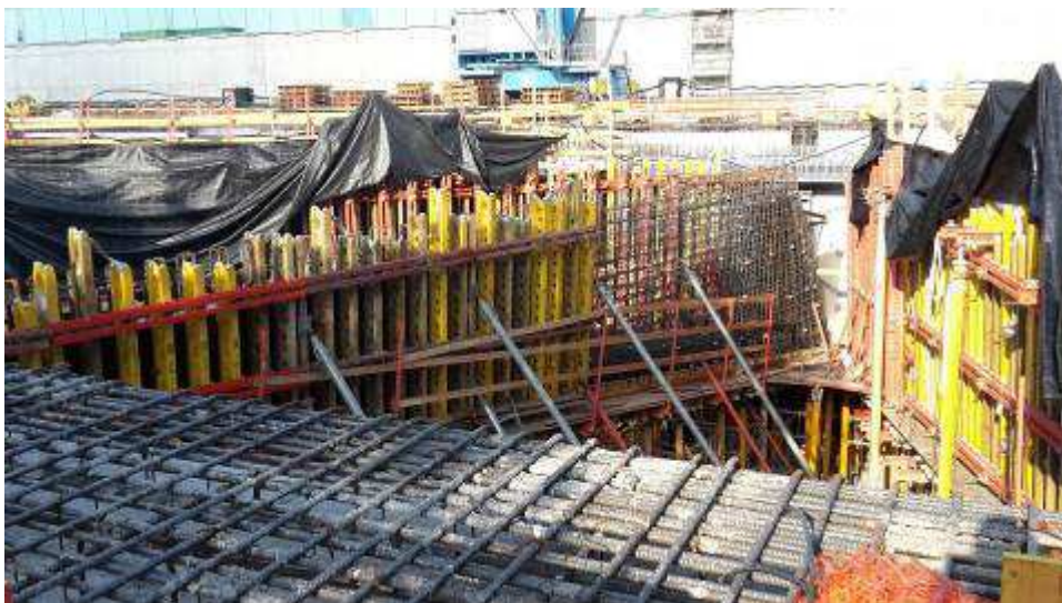
Foto 4 – Montaggio casseri e getto Travi intermedie e corte lato Ovest, Ventaglio Asse 17