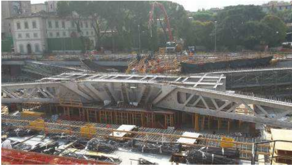
Foto 5 – Montaggio casseri e getto Travi intermedie e corte lato Ovest, Ventaglio Asse 17