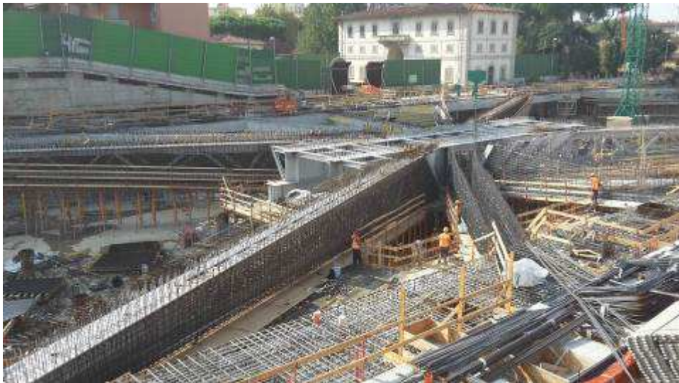
Foto 6 – Montaggio armatura Travi lunghe, intermedie e corte lato Est, Ventaglio Asse 25