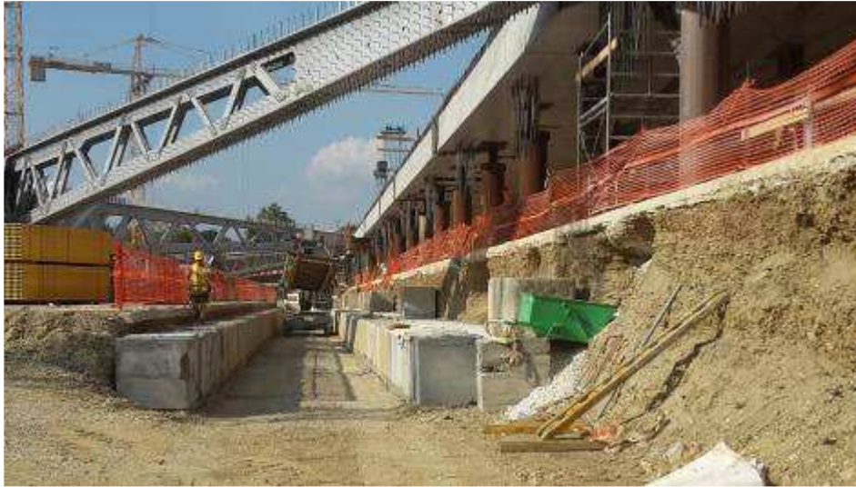
Foto 11 – Completamento scavo per realizzazione “Tunnel” di passaggio dei mezzi sotto i banchinaggi