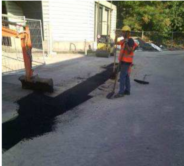
Foto 3 – Fortezza da Basso – Cavidotto per impianti Nuovo Pozzo O.P.D.