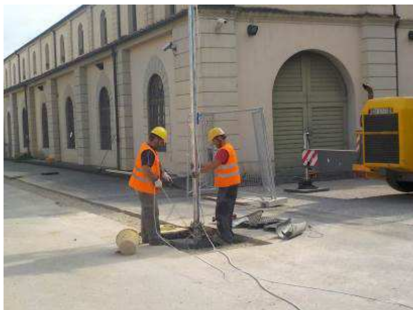
Foto 2 – Fortezza da Basso – Posa tubazione all'interno del Nuovo Pozzo O.P.D.