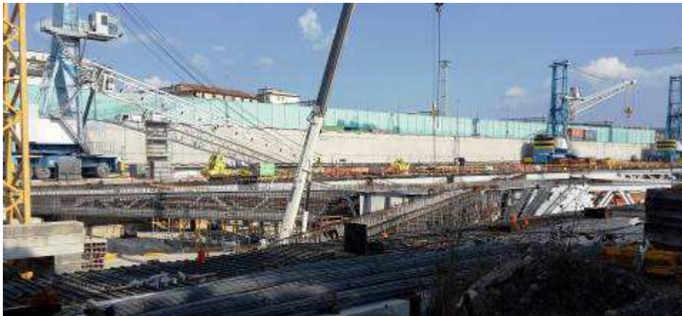
Foto 3 – Montaggio armatura Travi lunghe lato Ovest, Ventaglio Asse 9