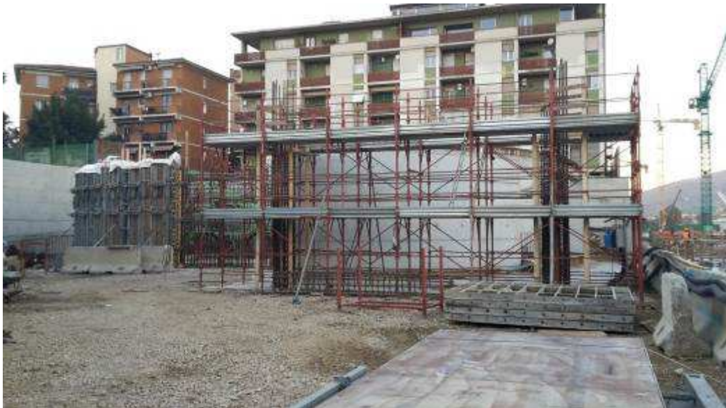
Foto 10 – Montaggio casseri e getto Muro MU10 e Scassero Trave e Pilastro MU4bis, Rampa Kiss&Ride