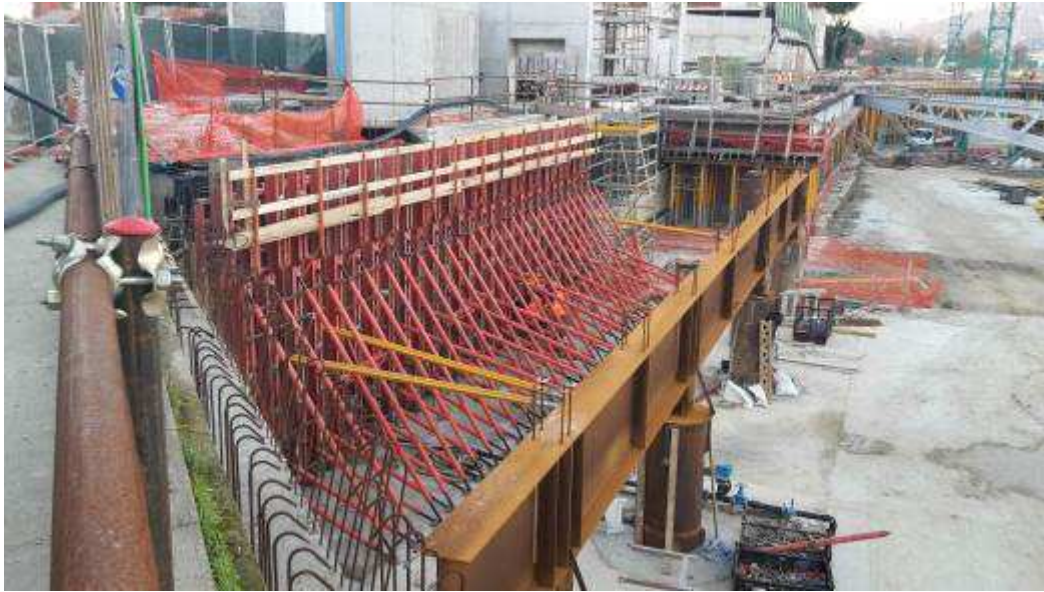
Foto 8 – Casseratura Cordolo di Testa Diaframmi in Testata Sud-lato Ovest