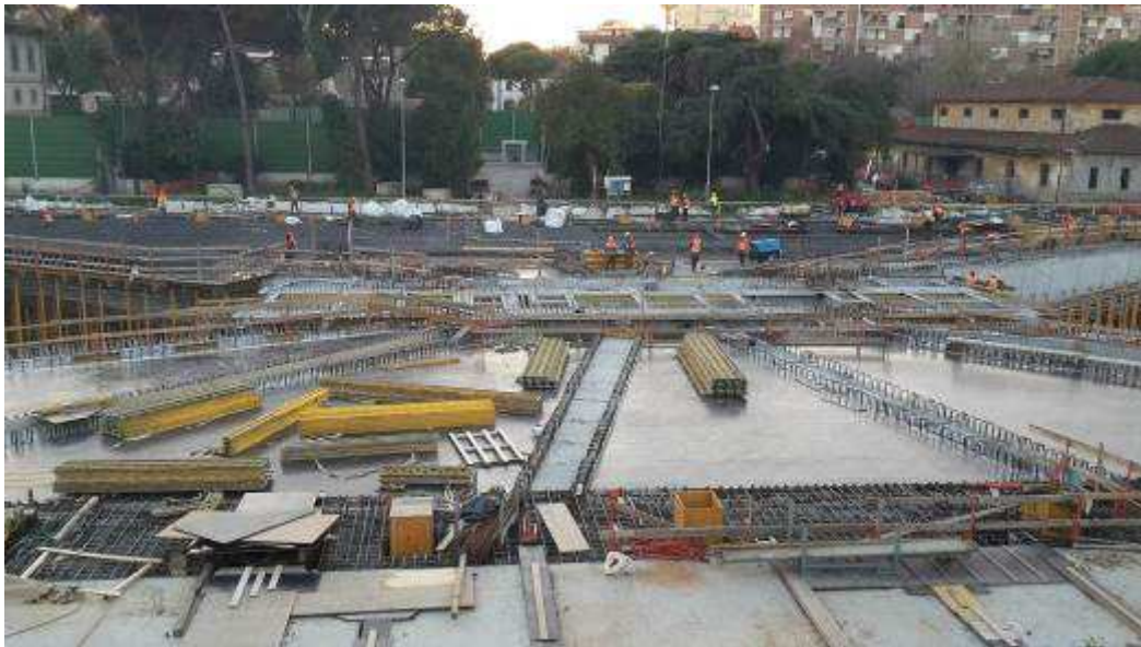
Foto 5–Banchinaggio Soletta lato Est e montaggio armatura lato Ovest, Ventaglio Asse 17