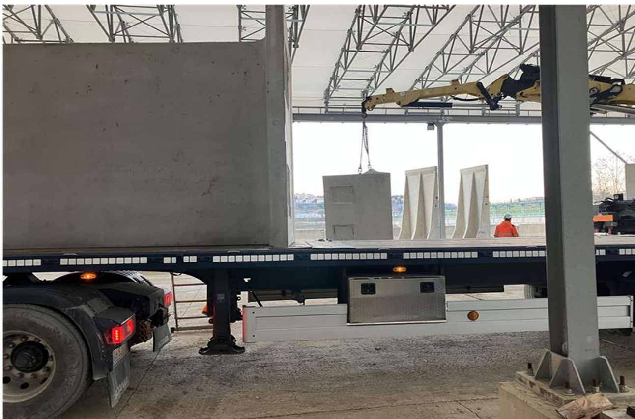
Figura 9 – Santa Barbara