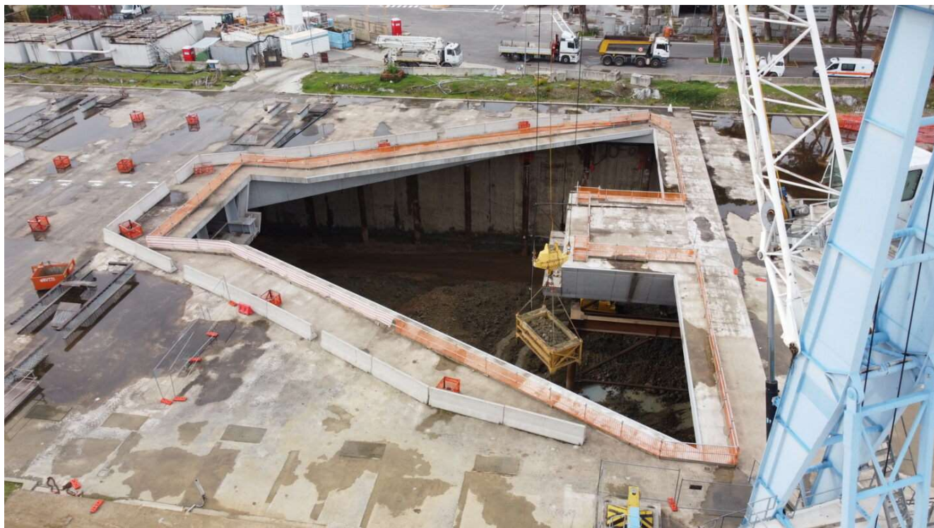
Figura 2 - Stazione AV - Carico Terre