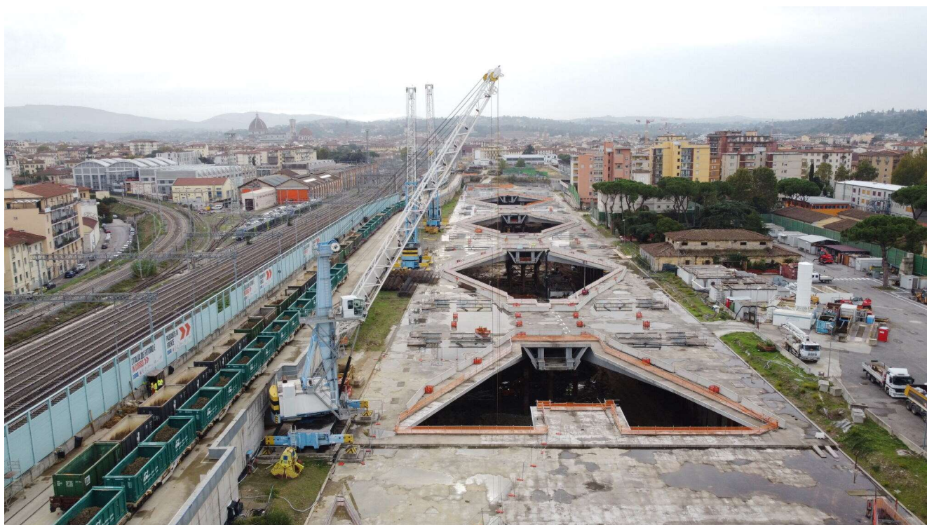
Figura 1 - Stazione AV