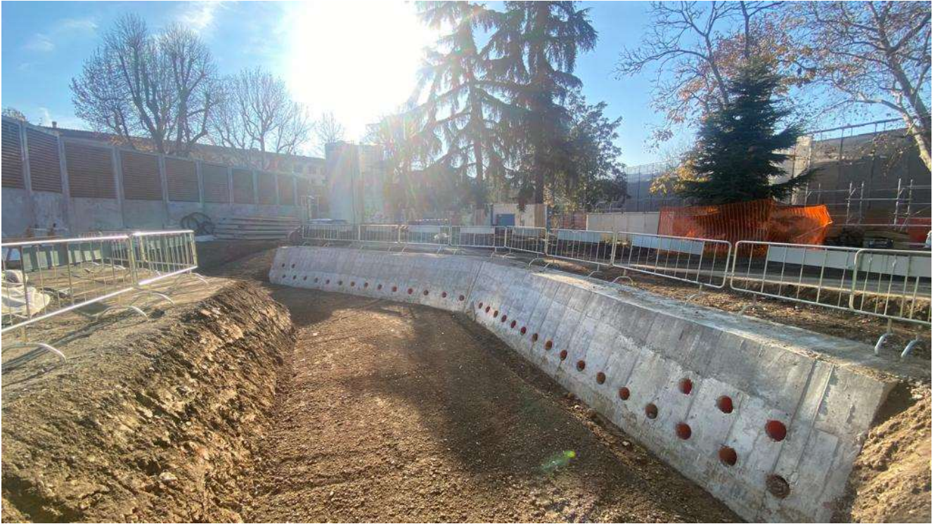
Figura 11 - Fortezza Area 1