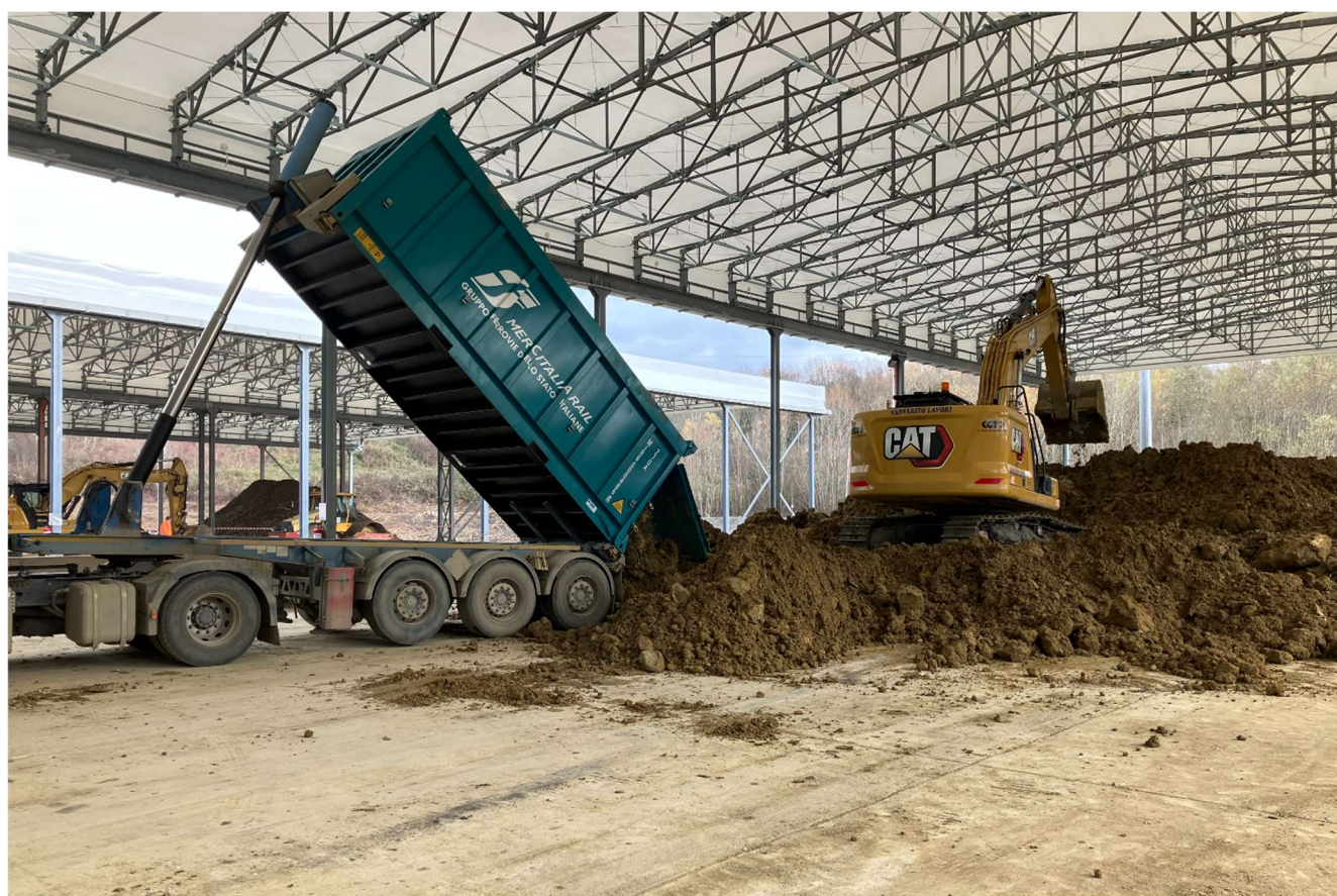
Figura 10 – Scarico Terre in piazzola (Santa Barbara)