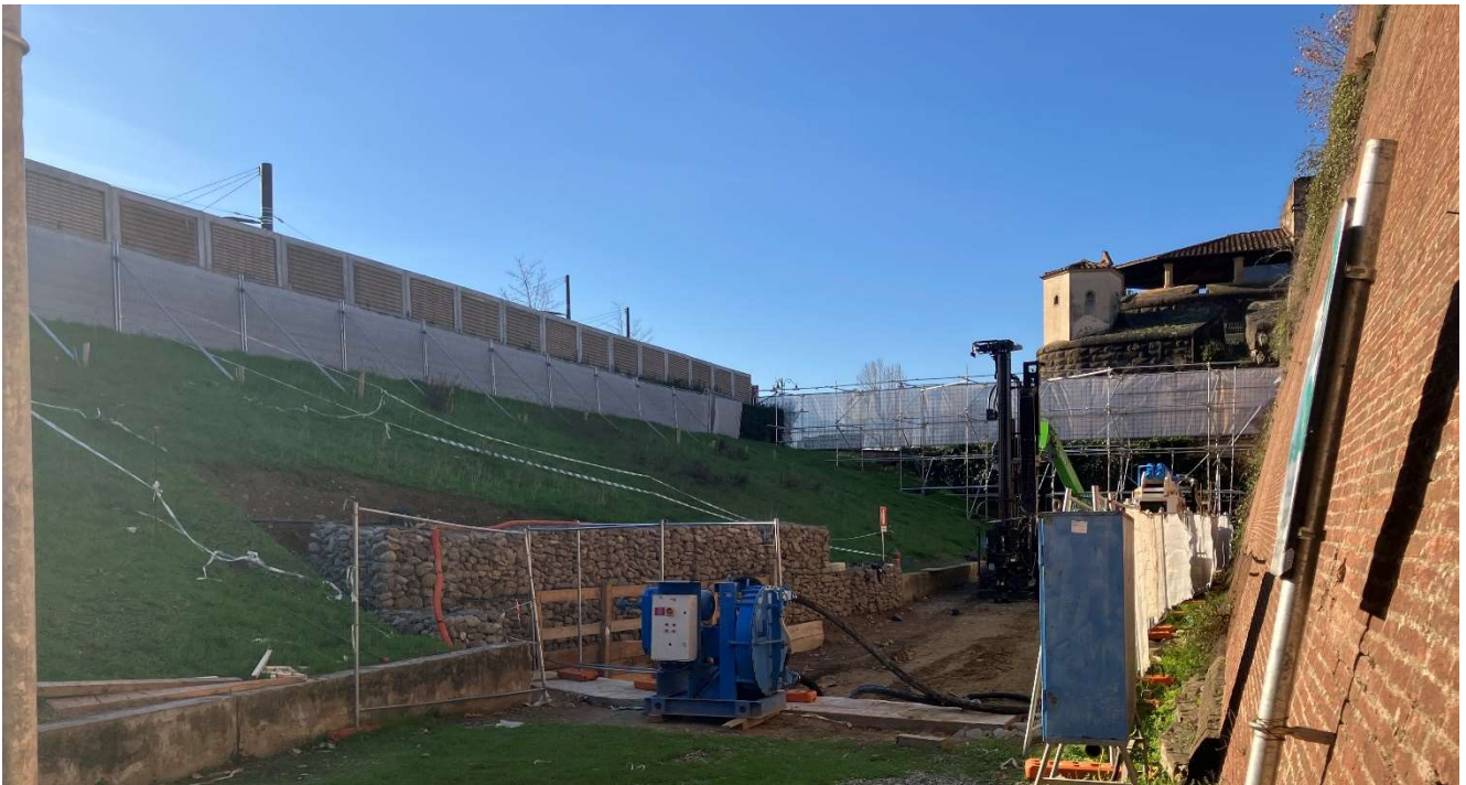
Figura 12 - Fortezza Area 2