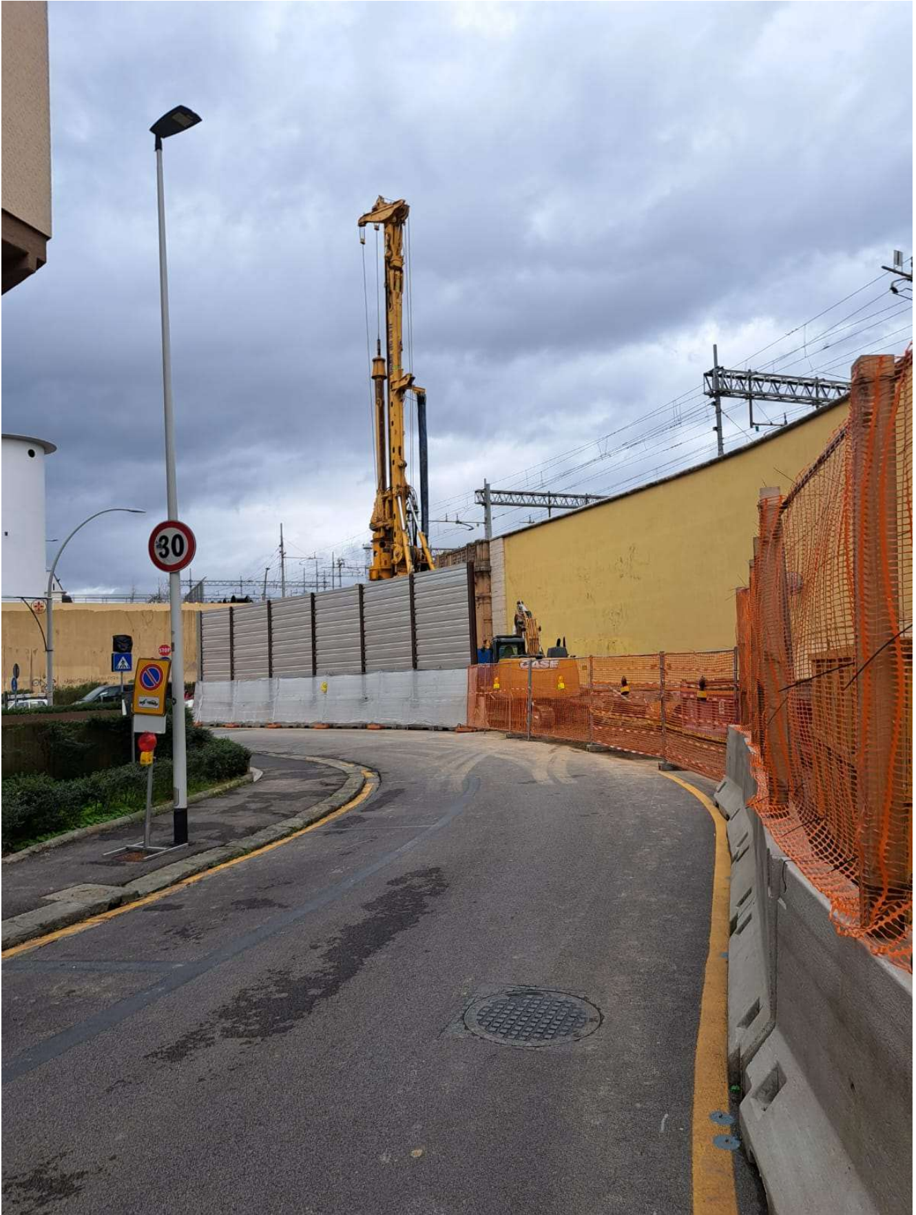
Figura 15 - Via Cittadella