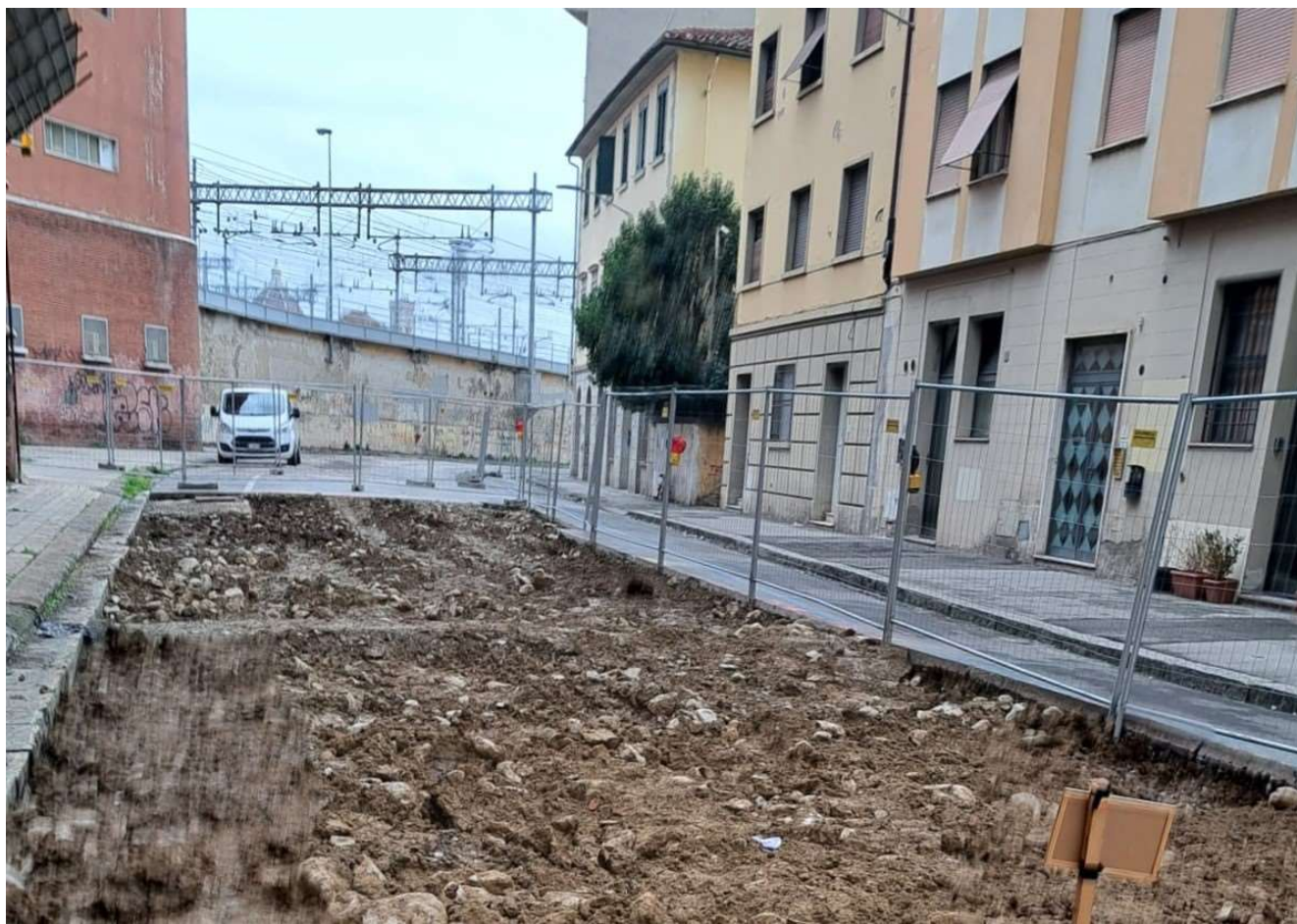
Figura 16 - Via delle Ghiacciaie