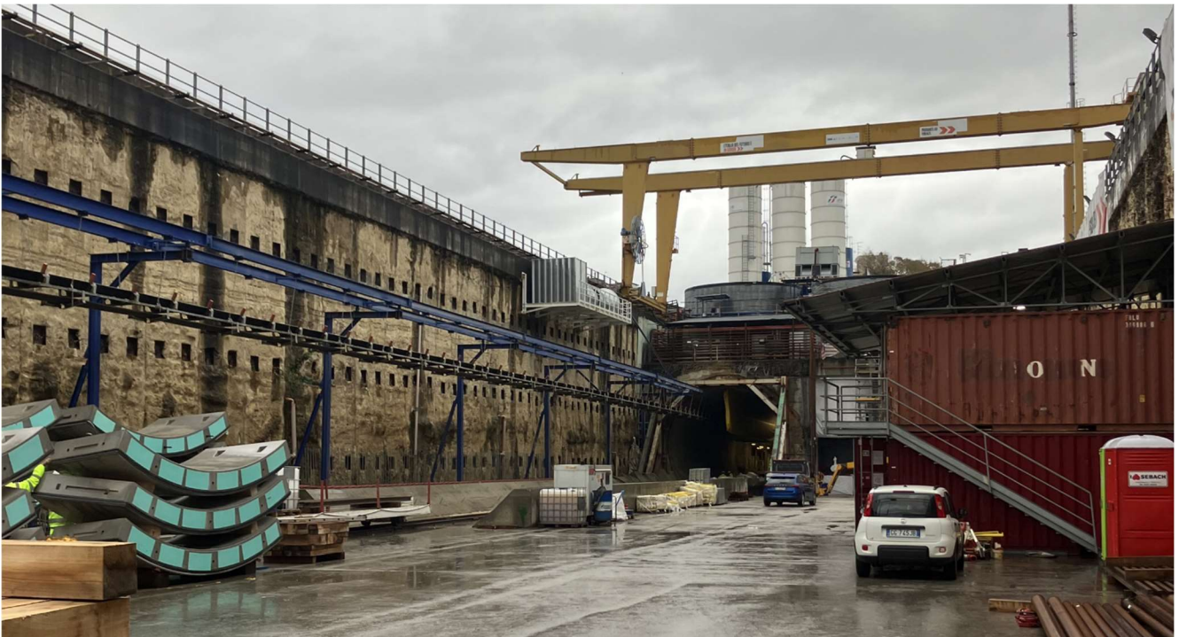
Figura 5 – TBM