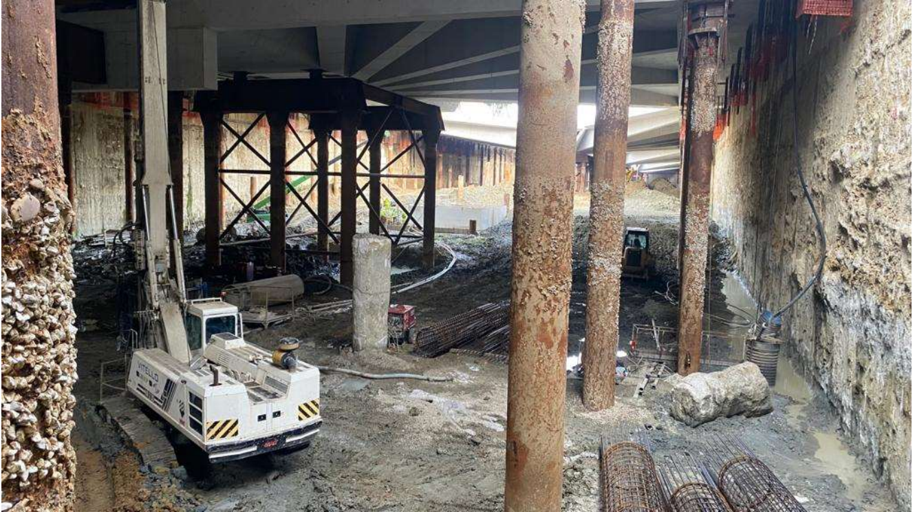
Figura 4 – Stazione AV