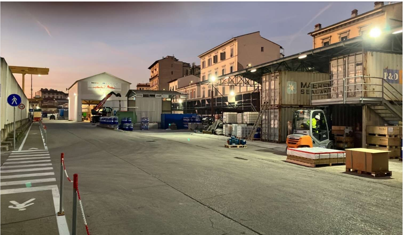
Figura 8 –Area di Cantiere Campo di Marte