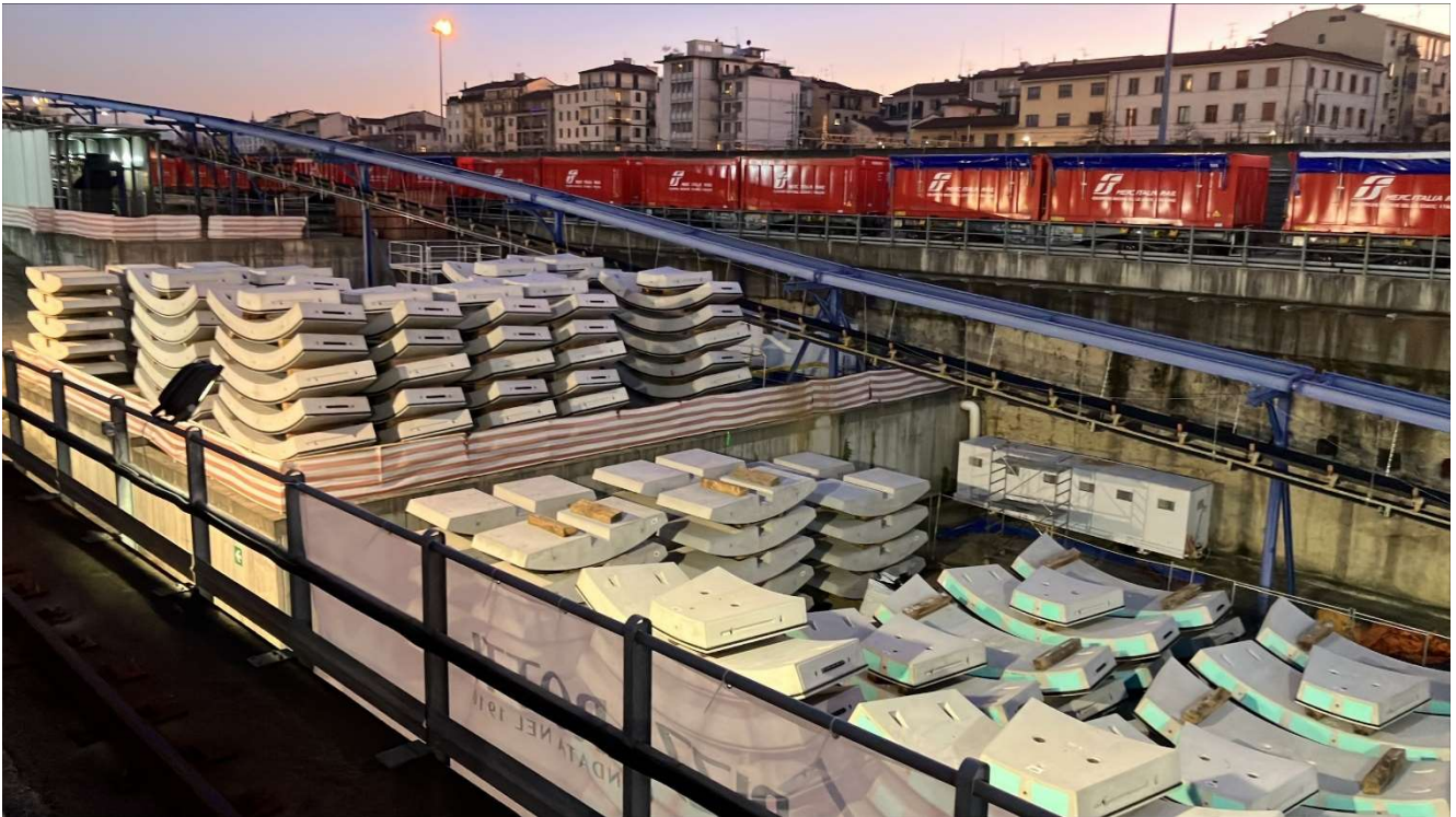
Figura 7 – Stoccaggio Conci (Campo di Marte)