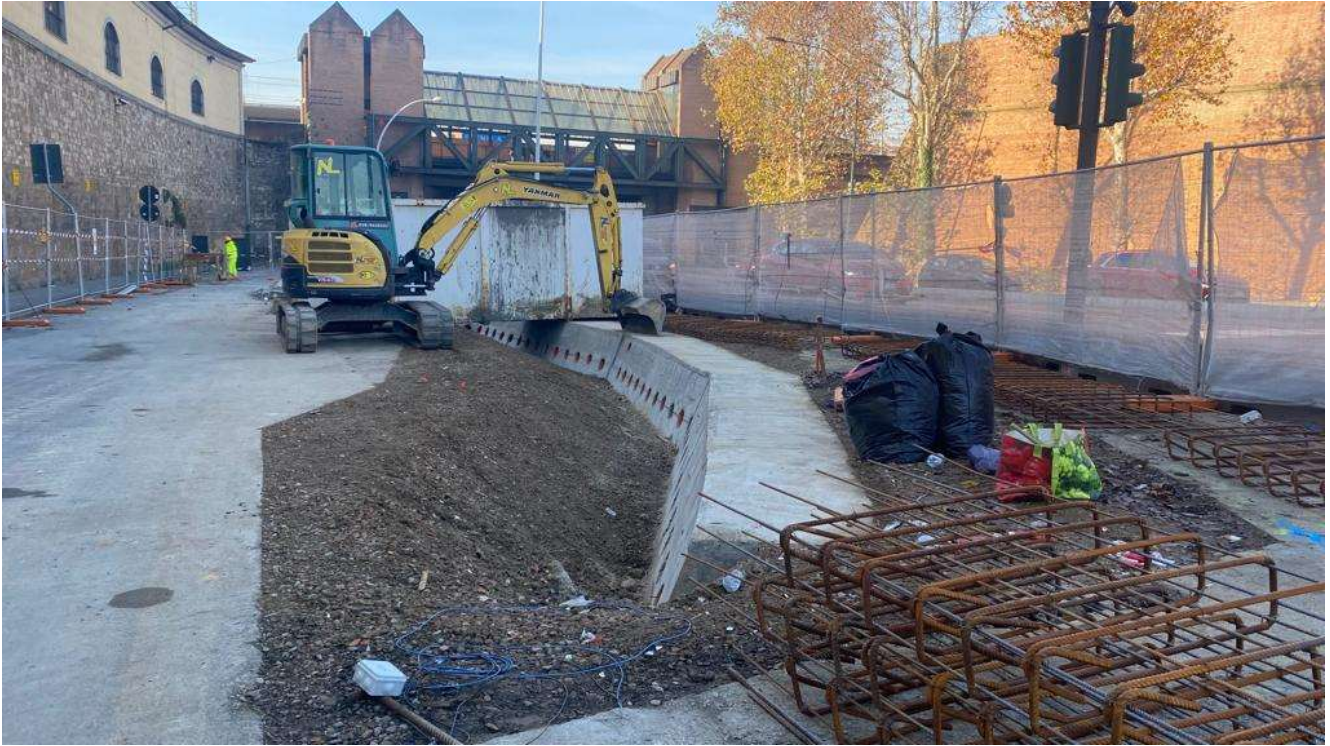
Figura 13 - Fortezza Area 3