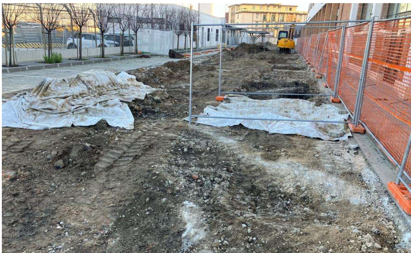
Figura 17 - Viale Redi