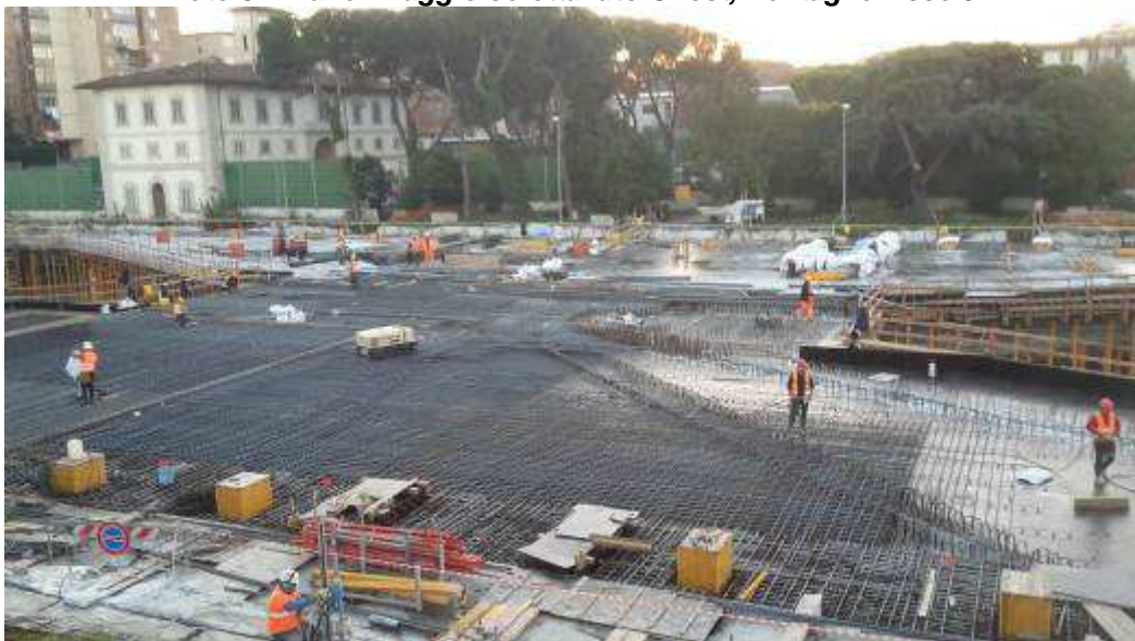
Foto 4 – Banchinaggio Soletta lato Est e montaggio armatura lato Ovest, Ventaglio Asse 17