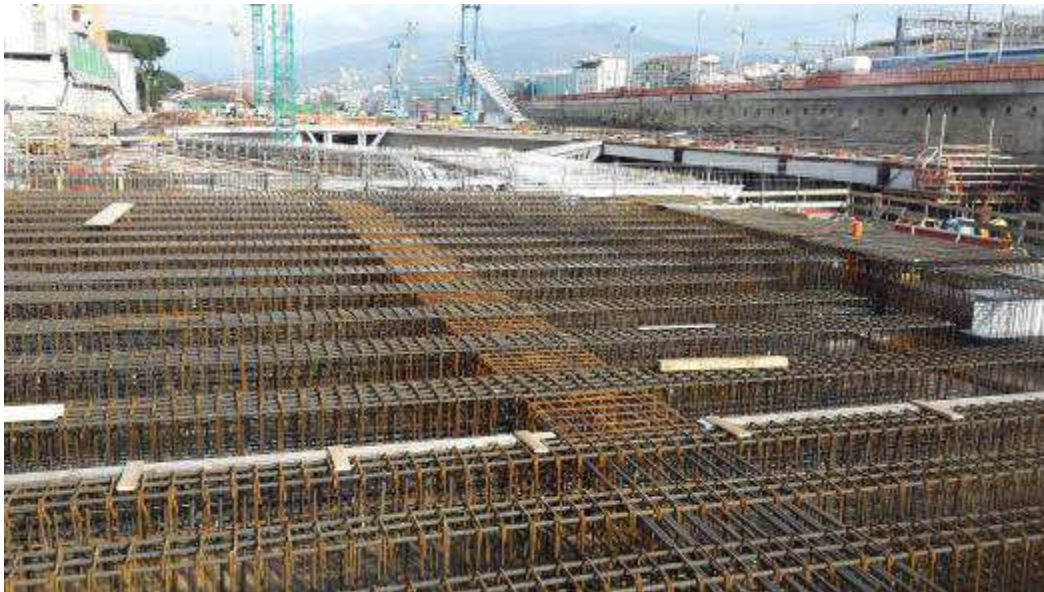
Foto 8 – Banchinaggio e Montaggio armatura Testata Sud - lato Ovest