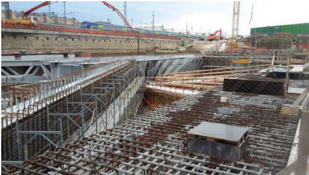
Foto 5 – Banchinaggio Travi intermedie e corte, Ventaglio Asse 33 - Lato Ovest