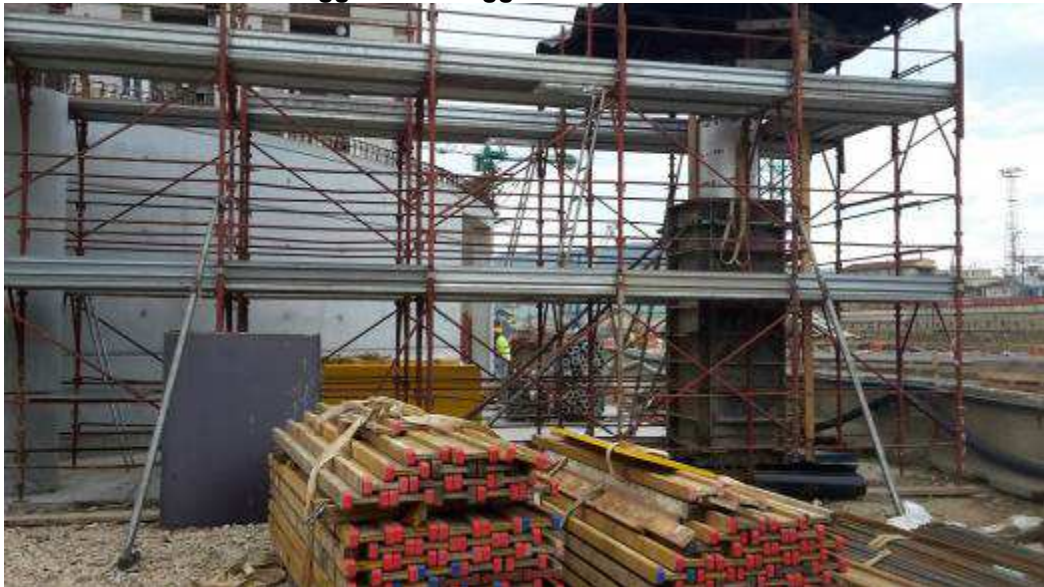
Foto 9 – Montaggio Armatura e Casseri Solaio e getto Pilastri, Rampa Kiss&Ride