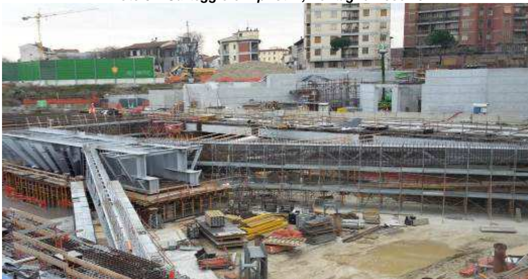
Foto 4 – Montaggio armatura Trave Lunga, Ventaglio Asse 33 - Lato Ovest