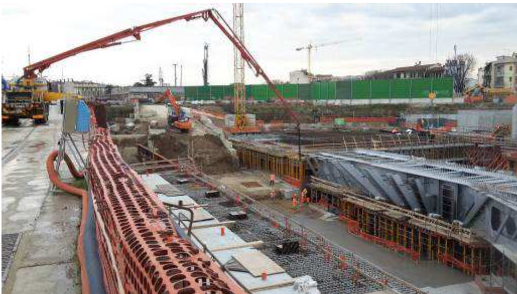
Foto 6 – Getto Platea per appoggio casseri, Ventaglio Asse 33 - Lato Est