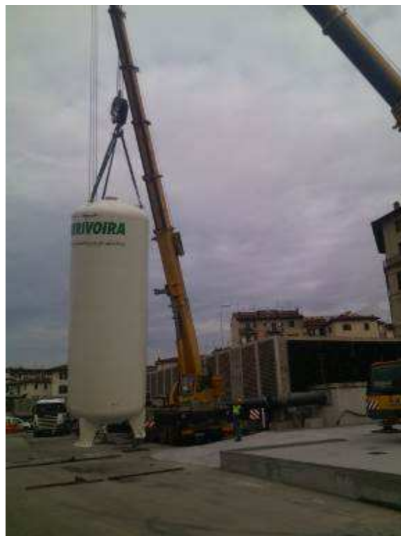
Foto 1 – Montaggio Nuovo Impianto di Stoccaggio Anidride Carbonica