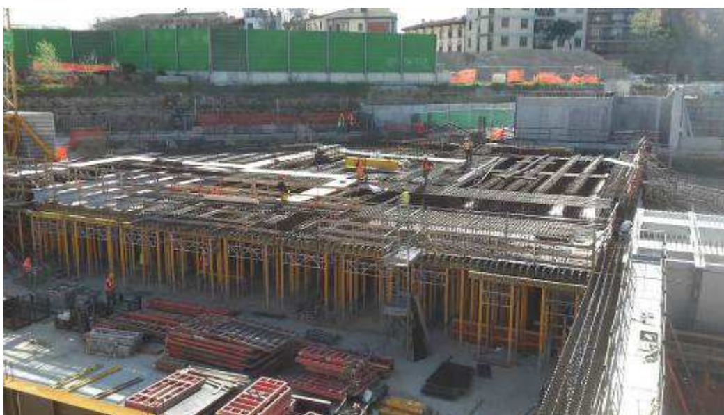
Foto 8 – Banchinaggio e Montaggio armatura Solaio liv. 00 Testata Sud - lato Ovest