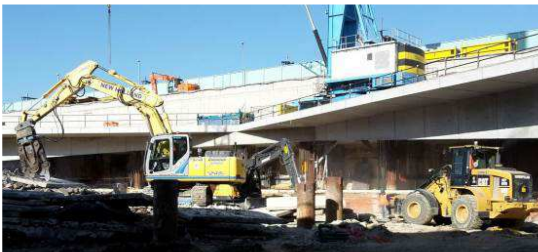
Foto 2 – Rimozione Platee per appoggio puntelli banchinaggio, Ventaglio Asse 17