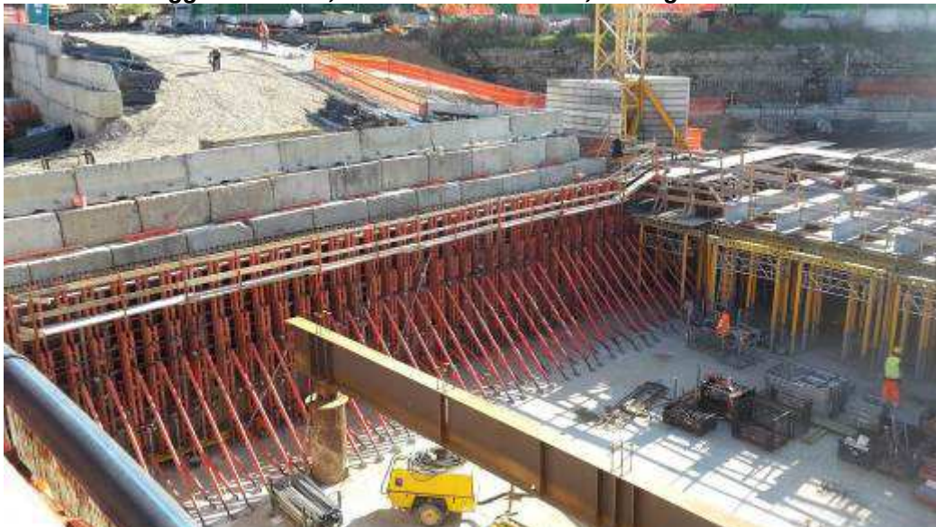
Foto 7 – Montaggio armatura e Casseri Cordolo di testa Diaframmi Lato Sud-Est, Zona Testata Sud