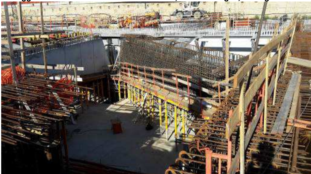
Foto 6 – Montaggio armatura, casseri e Getto Travi, Ventaglio Asse 33 - Lato Ovest