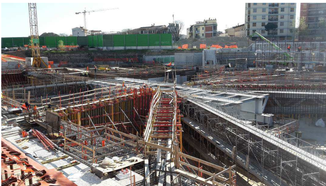
Foto 5 – Montaggio armatura e casseri Travi Intermedie, Corte e Lunghe, Ventaglio Asse 33 - Lato Est