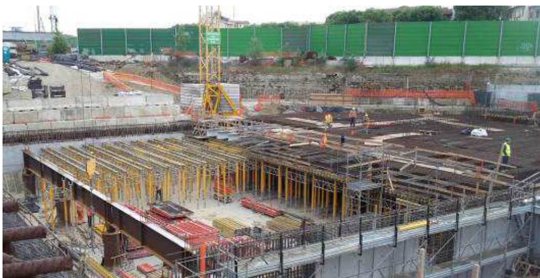
Foto 6 – Banchinaggio e Montaggio armatura Solaio liv. 00 Testata Sud - lato Est