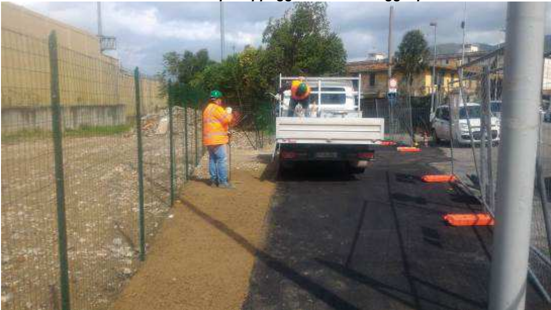
Foto 4 – Sistemazione area edificio demolito in via Reginaldo Giuliani