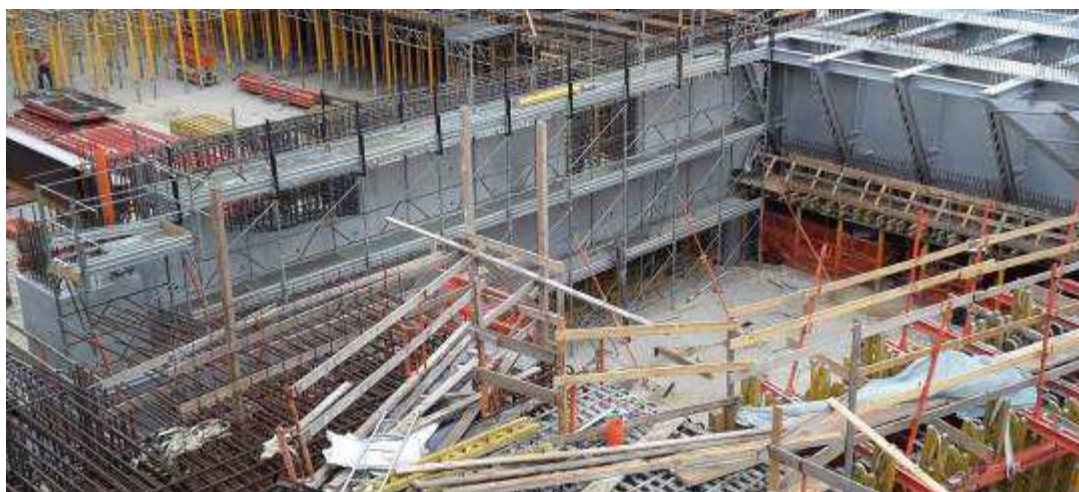
Foto 7 – Scassero Trave TPT01 Testata Sud - lato Est