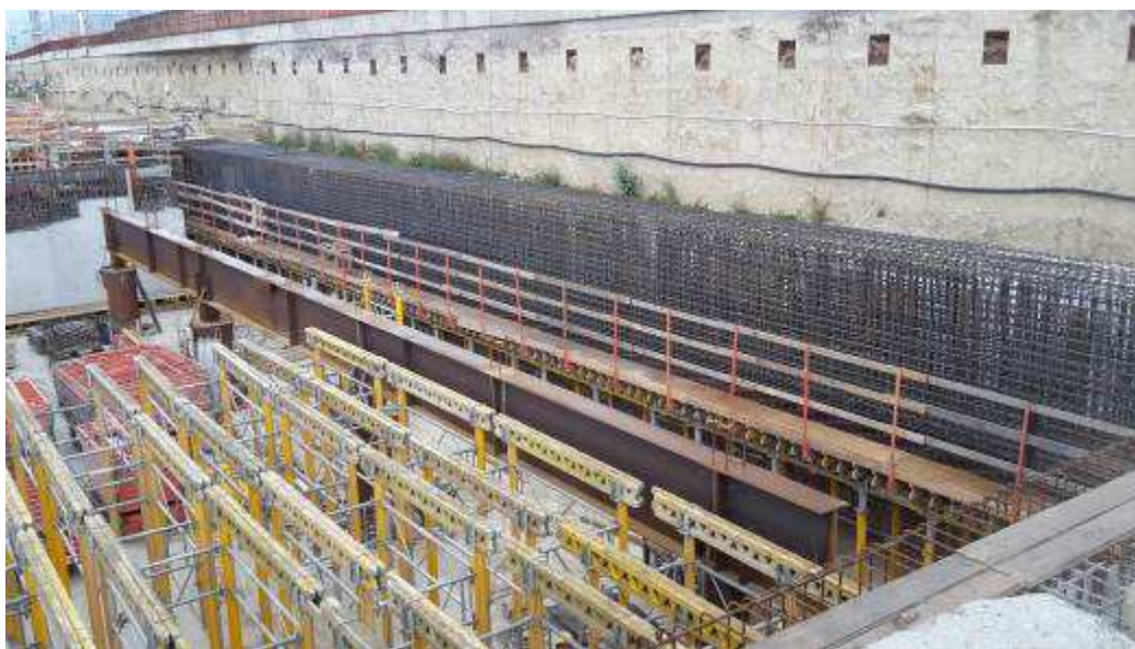
Foto 5 – Montaggio armatura Cordolo di testa Diaframmi Lato Est, Zona T. Sud