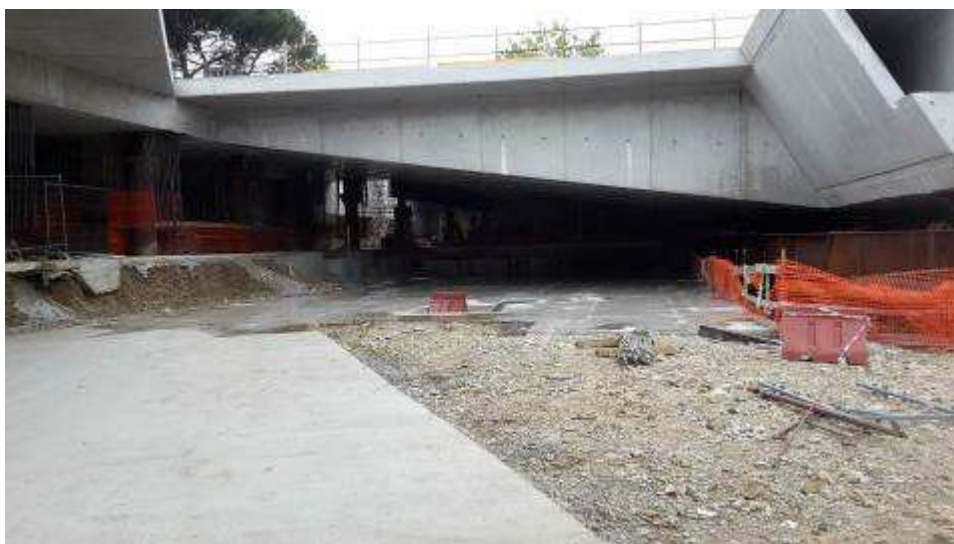
Foto 1 – Taglio platee per appoggio Puntelli dei Banchinaggi, Solaio fili 3-5