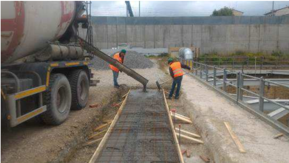
Foto 3 – Realizzazione Fondazione per appoggio Scala Ponteggio per l'accesso al Pozzo