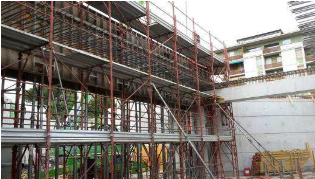
Foto 8 – Montaggio armatura, casseratura e getto Trave T.01.C02B, Rampa Kiss&Ride