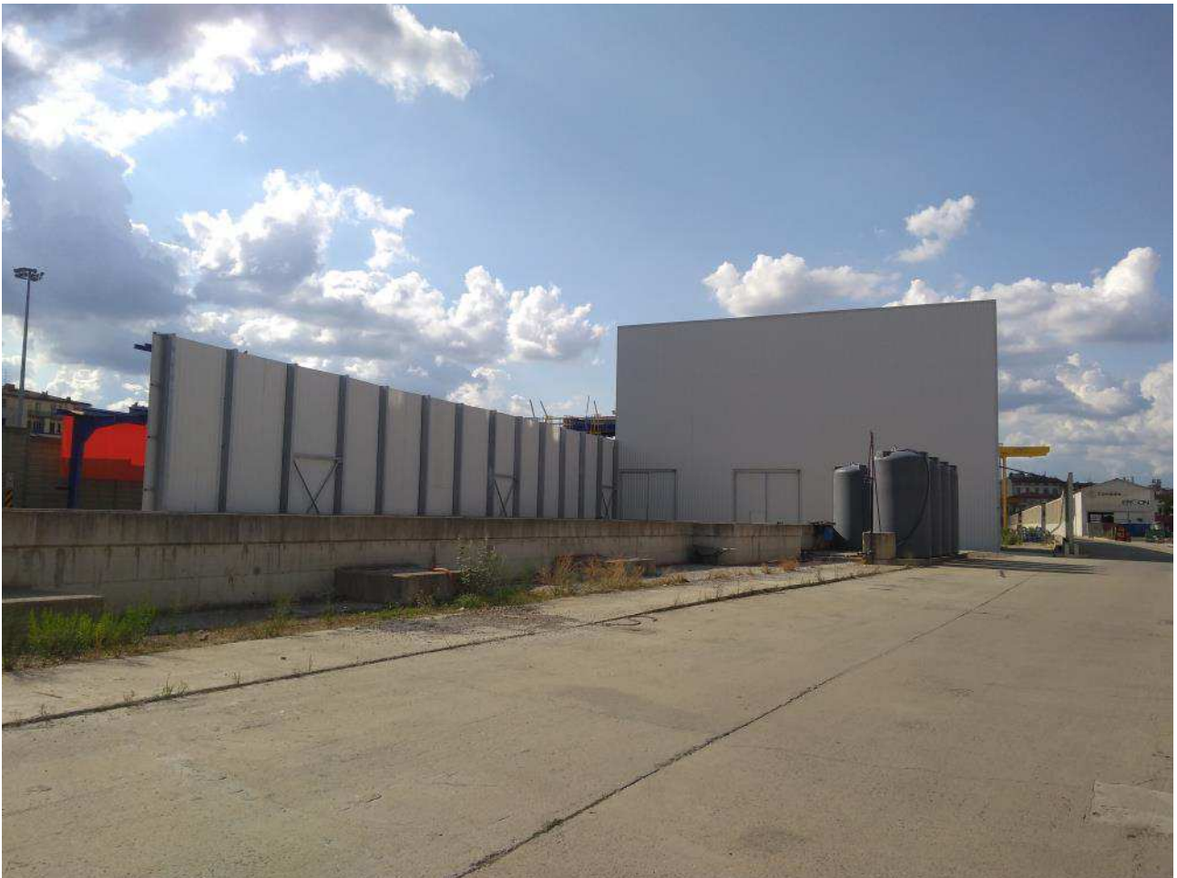
Foto 1 – Barriere antirumore per schermatura nastro – Area Campo di Marte