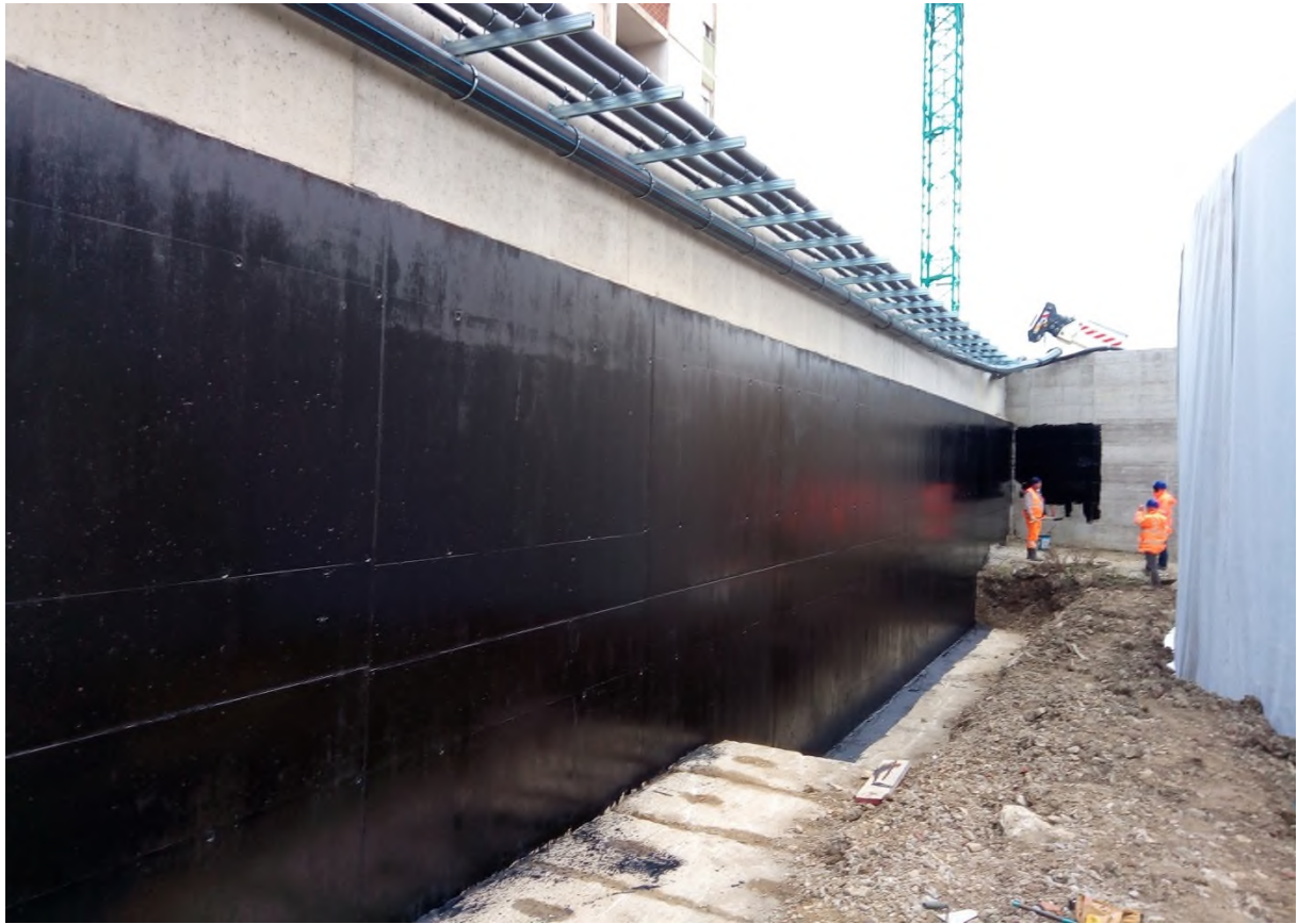
Foto 4 – Impermeabilizzazione muro di confine a tergo rampa Kiss & Ride