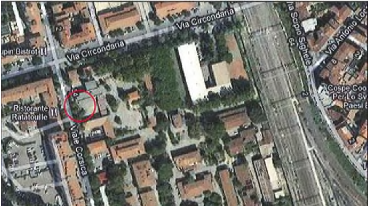
Allegato 1: Passo carrabile via di fuga Viale Corsica