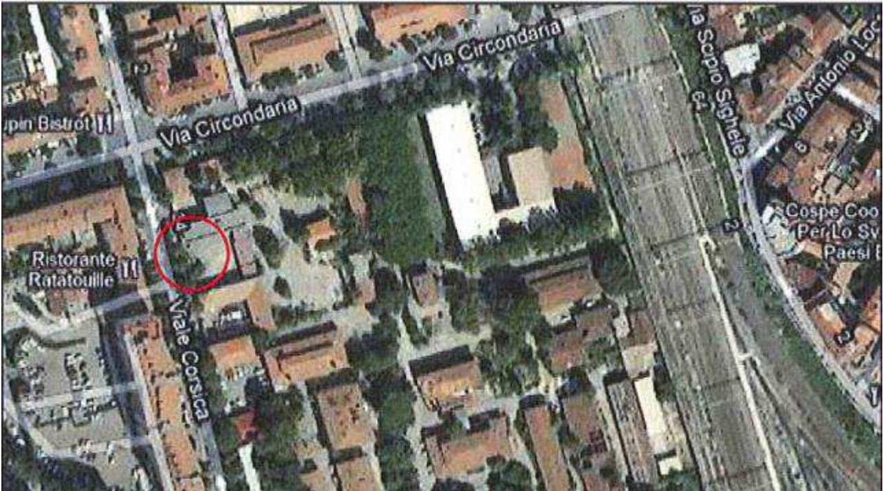
Allegato 1: Passo carrabile via di fuga Viale Corsica