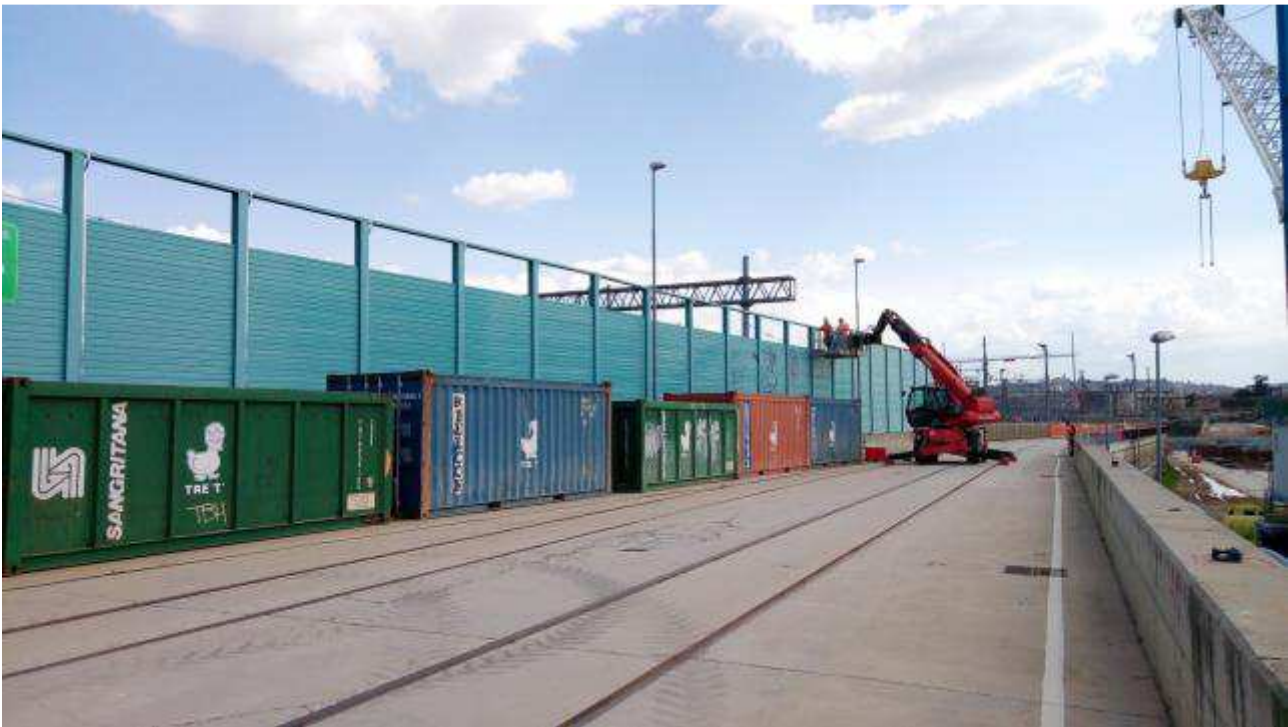
Foto 1 – Messa in sicurezza barriere antirumore corridoio attrezzato