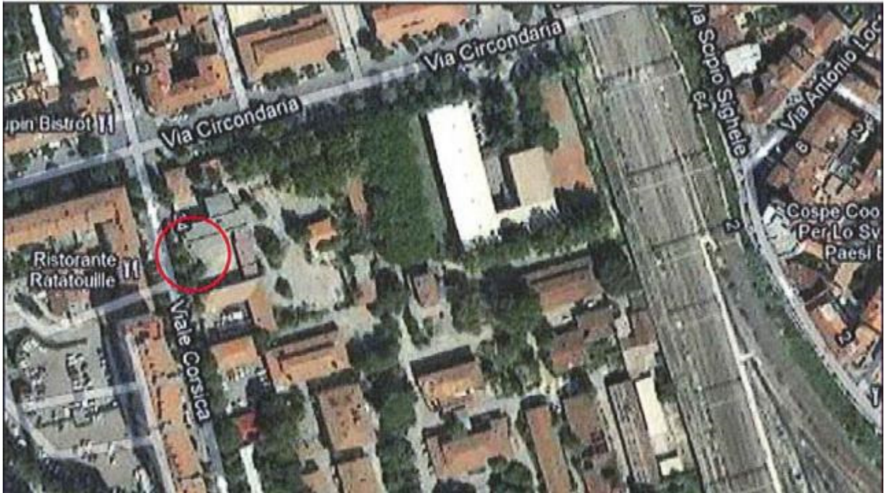
Allegato 1: Passo carrabile via di fuga Viale Corsica