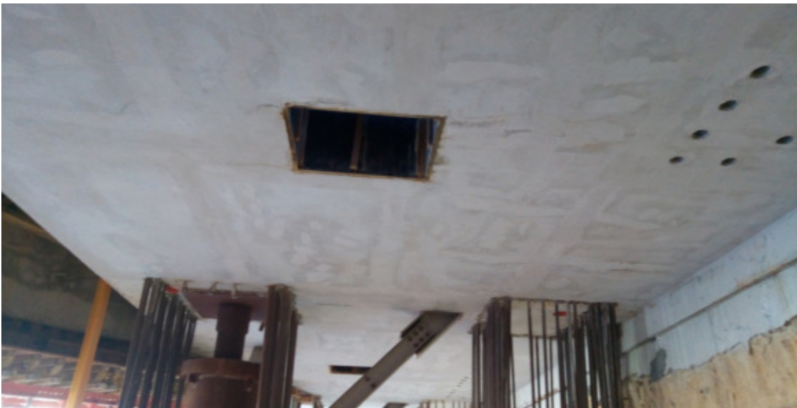
Foto 1 – Interventi di ripristino su trave cuscino ovest, Ventaglio33